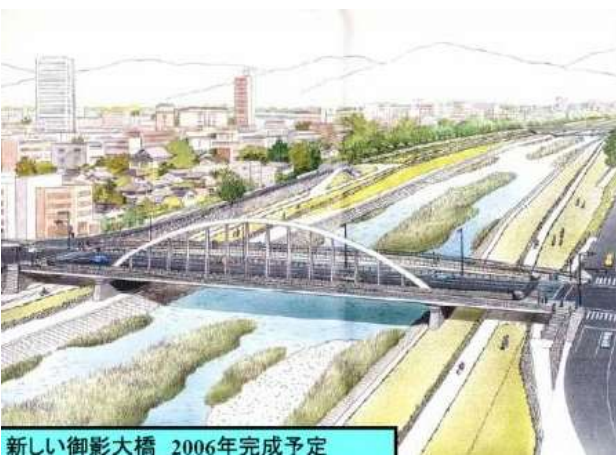
新しい御影大橋 2006年完成予定