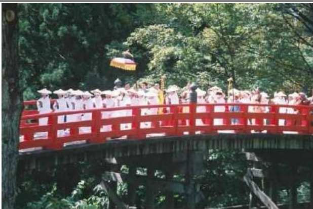
富山立山・芦峯寺 布橋灌頂会 2005.9.18