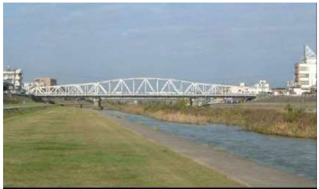
KJK208.御影大橋、石川県金沢市、1951 浅野川