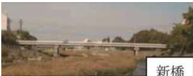
KJK213.新橋、石川県金沢市