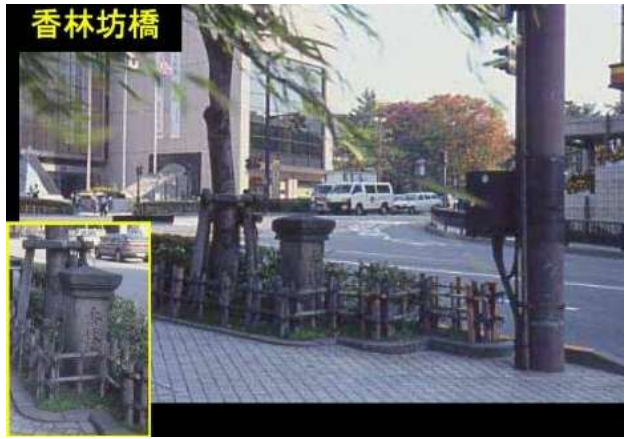
KJK206.香林坊橋、石川県金沢市、1911/1699