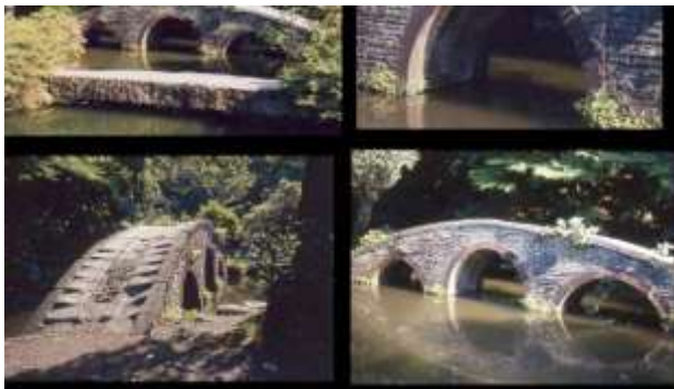
KJK203. 図月橋、石川県金沢市、1642