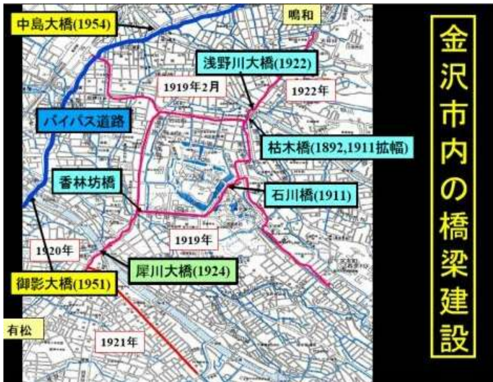
KJK202. 石川県金沢市内の橋梁建設