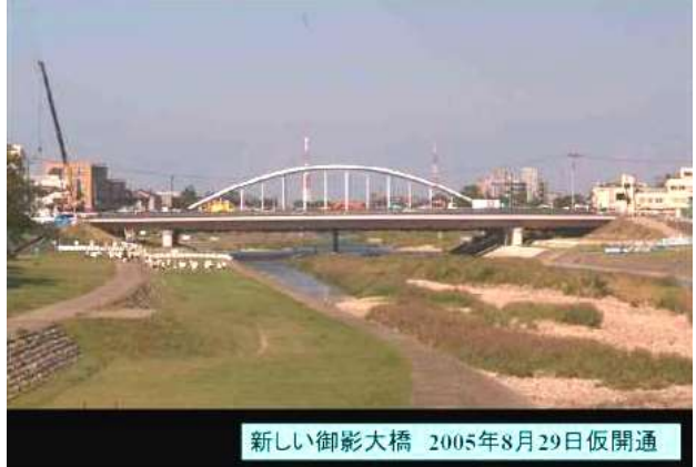
KJK210. (新)御影大橋(2005)、石川県金沢市、浅野川