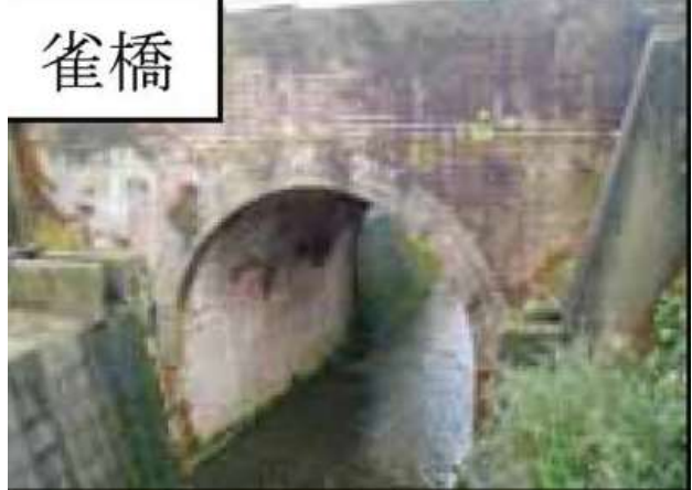
KJK243.雀橋、石川県金沢市