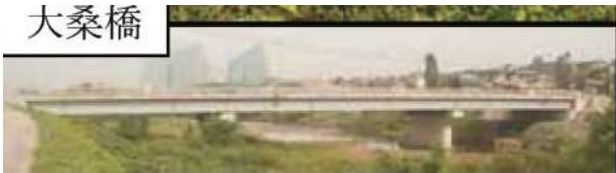
KJK225.大桑橋、石川県金沢市、犀川、