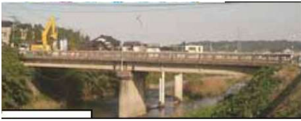
KJK242.下田上橋、石川県金沢市、浅野川