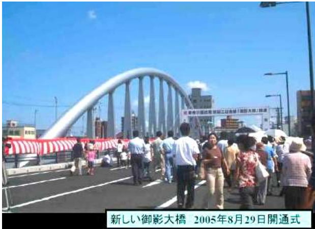
KJK211. (新)御影大橋(2005)、石川県金沢市、2005、浅野川