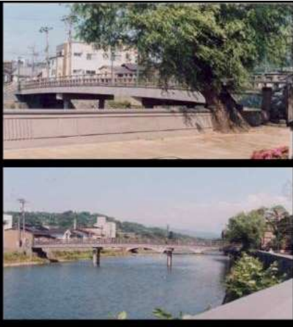
KJK234.中の橋、石川県金沢市、浅野川