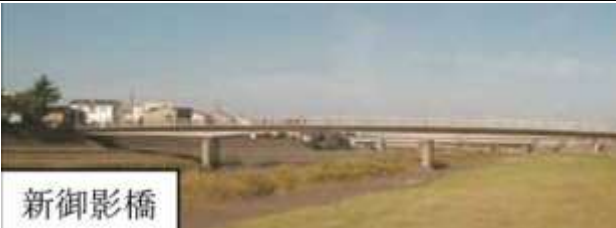
KJK207、新御影橋、石川県金沢市