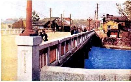
Sasayama Bridge Kanazawa. 猪大川橋 (所名澤金)