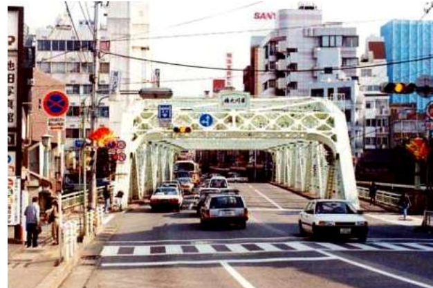
KJK220.犀川大橋、カラー画像、石川県金沢市、犀川、1995?、カラー画像、市電は撤去された