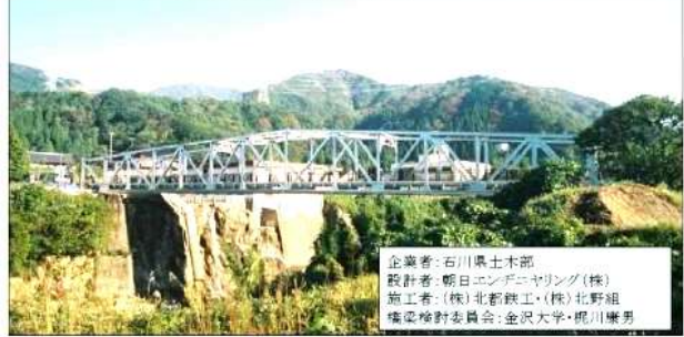
KJK212.金名橋、石川県、(手取川)、御影大橋の解体部材を利用した自転車専用道の橋、キャニオンロード