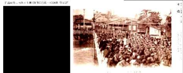
KJK216.犀川大橋、石川県金沢市、犀川、木橋