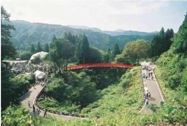
富山立山・芦峯寺 布橋灌頂会 2005.9.18