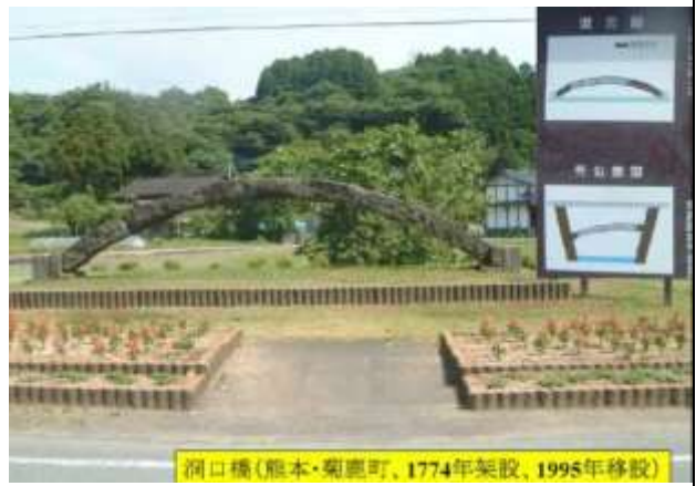
KJK255.洞口橋、熊本県菊鹿町、1774年仮設、1995年 移設