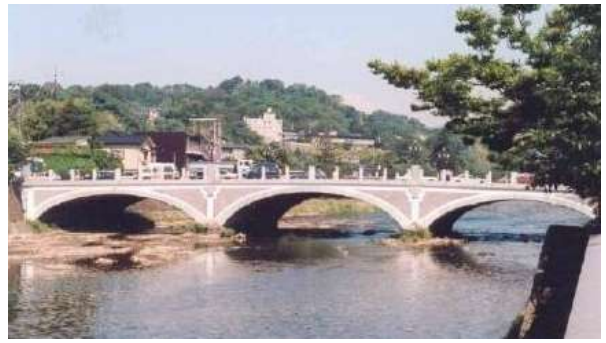
KJK235、浅野川大橋、石川県金沢市、1922/1594、国登録有形文化財、RC充腹アーチ