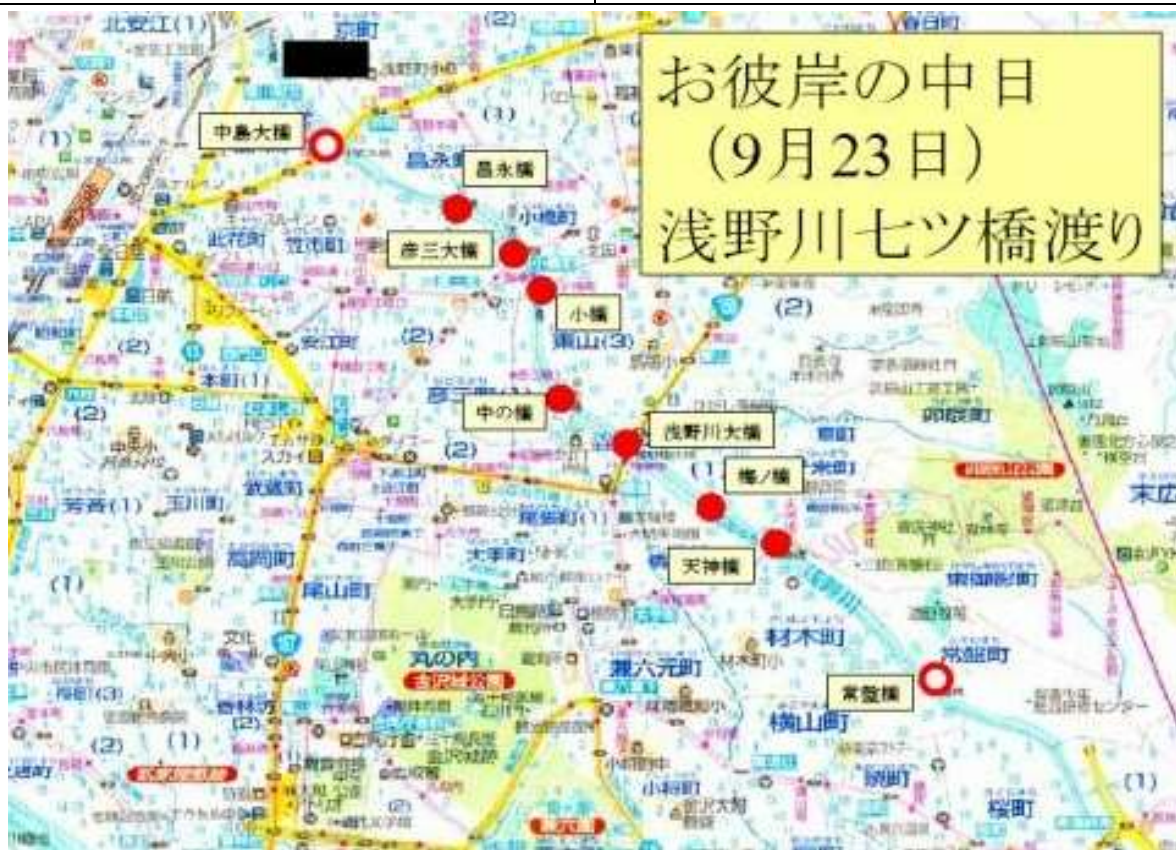
KJK227.石川県金沢市、浅野側沿いの7つの橋の位置図