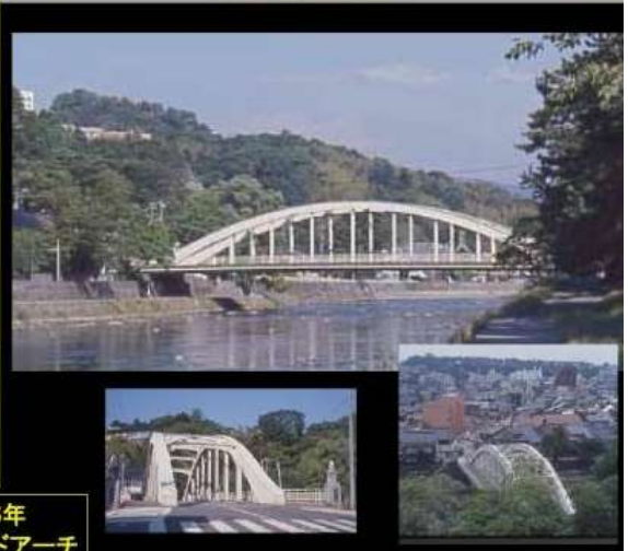
KJK237.天神橋、石川県金沢市、浅野川、