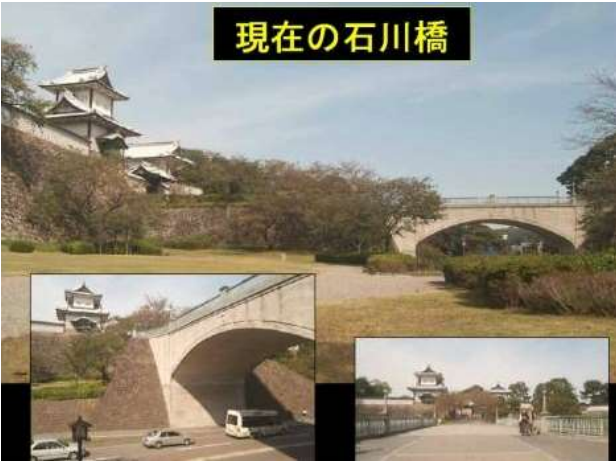
KJK205.石川橋画像(1990年頃)、石川県金沢市