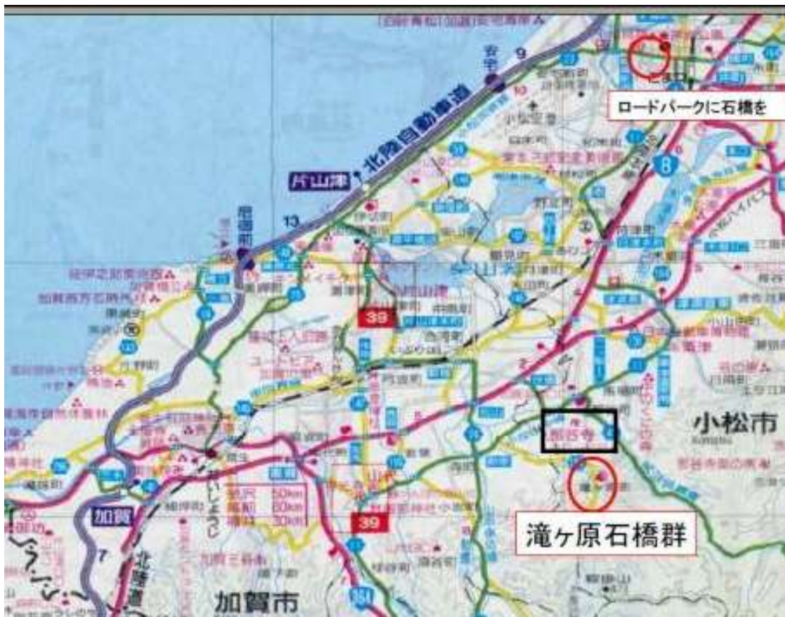
KJK247. 滝ヶ原石橋群位置図、石川県小松市周辺地図