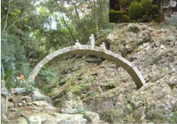
KJK254、方広寺石橋、静岡県 引佐、リブアーチ、 1770年頃