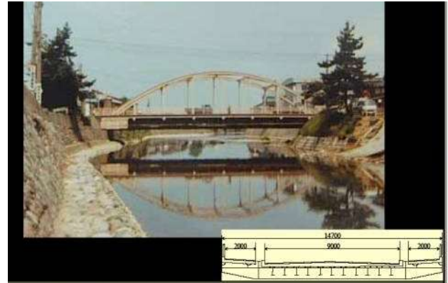
中島大橋(1954年完成)、鋼下路ローゼ桁橋・日本で3番目

KJK229.中島大橋(1954) 石川県金沢市、浅野川、日本で三番目の鋼下路ローゼ、設計荷重が小さいので、この後補強された。