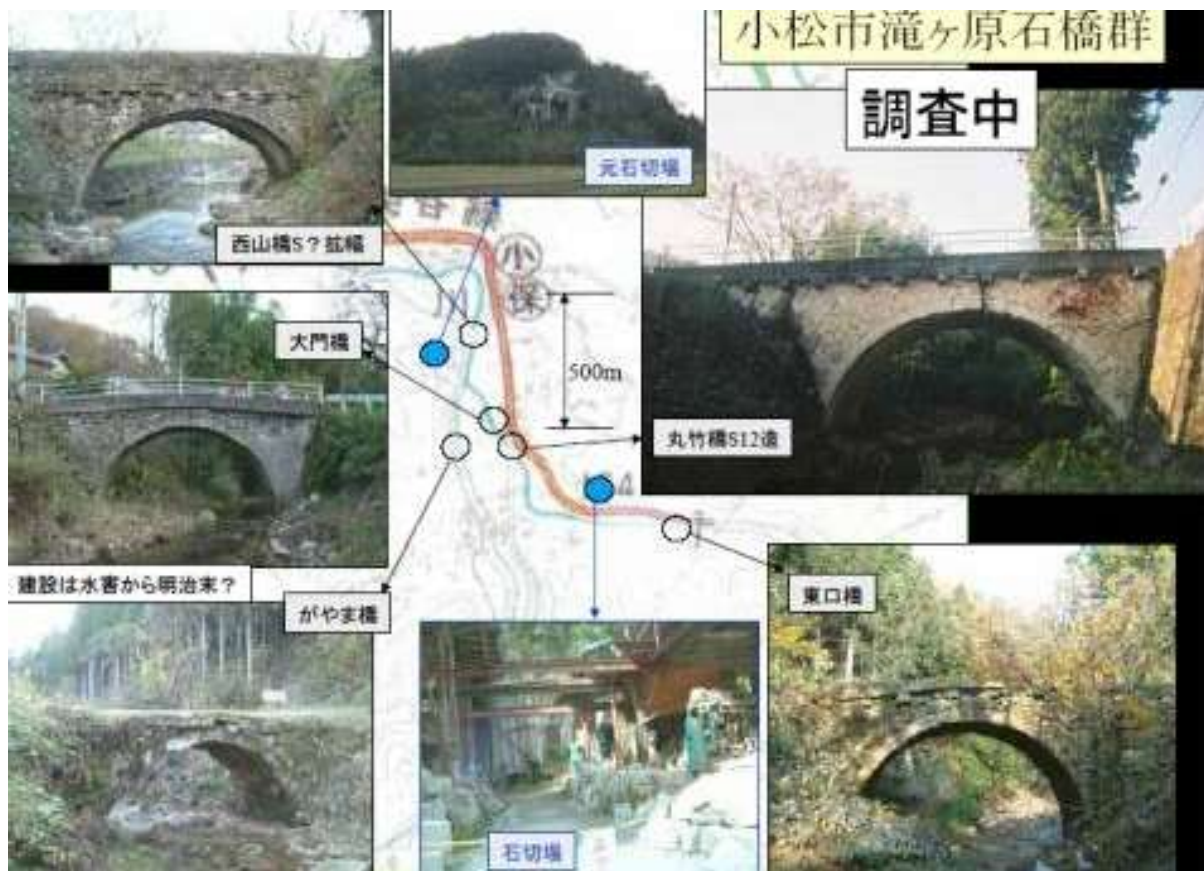
KJK248. 石川県小松市滝ヶ原石橋群滝ヶ原石橋