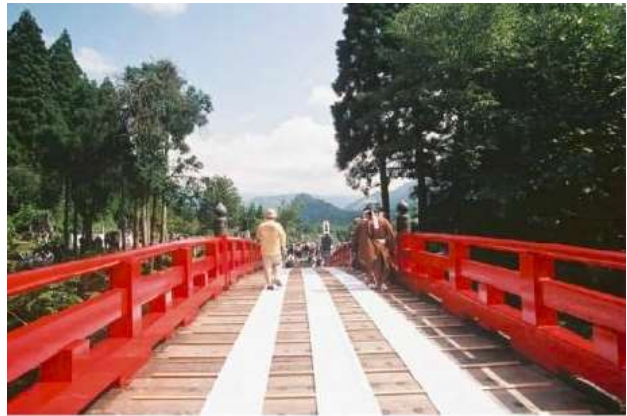
富山立山・芦峯寺 布橋灌頂会 2005.9.18