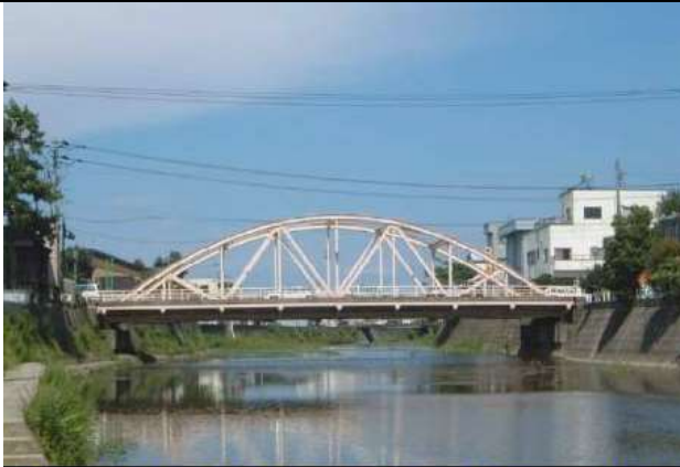
中島大橋(1954年架)、鋼製下路ローゼ桁橋

KJK229.中島大橋(1954) 石川県金沢市、浅野川、日本で三番目の鋼下路ローゼ、設計荷重が小さいので、この後補強された。