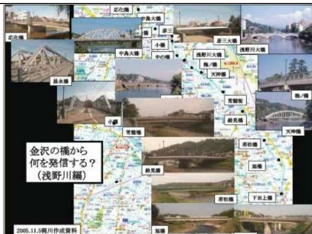
KJK226.石川県金沢市、浅野川沿いの橋