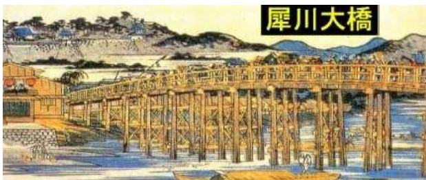
KJK215.犀川大橋、石川県金沢市、犀川、錦絵