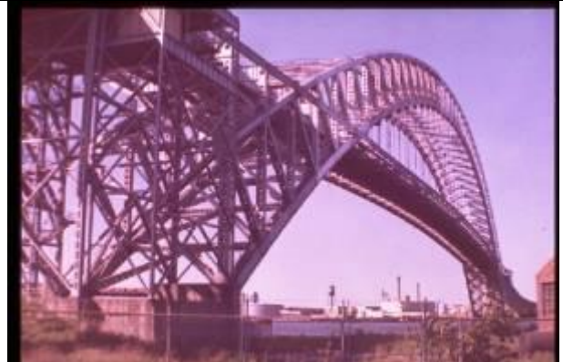
KRS053、ベイヨヌ橋、US、NY、鋼2ヒンジアーチ、1931、504m、世界第2位