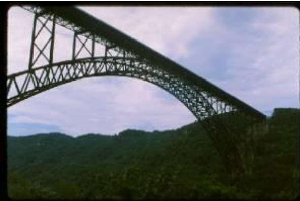
KRS055、ニューリバーゴージ橋、US、Wヴァージニア、鋼2ヒンジアーチ、1978、518m、世界第1位の支間、耐候性鋼製