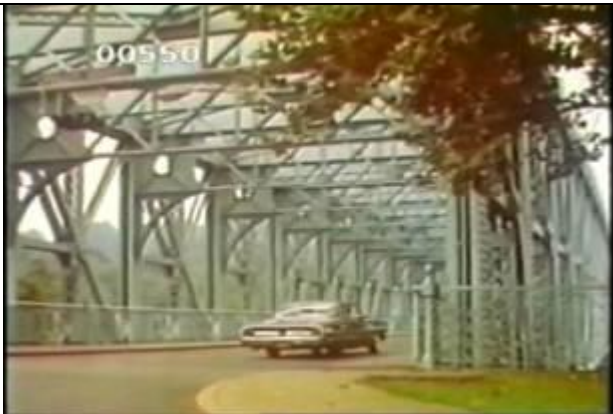
550、KRNT000402、フォール橋、US、フィラデルフィア、 入口附近の路上で斜めからほぼ全景を撮影、トラス橋、