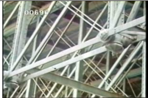
696、KRNT000408、不明橋、US、フィラデルフィア、下弦材のトラス格点部、トラス橋、19740000