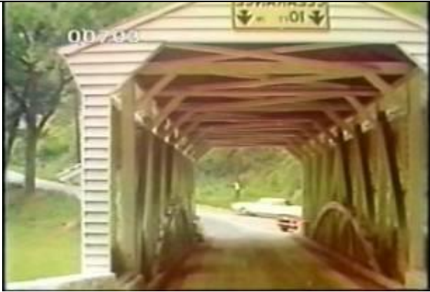
703、KRNT000416、不明橋、US、ペンシルバニア？、橋の入口附近の路上で撮影、カバブリッジ