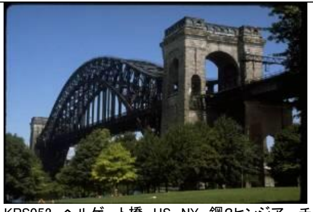
KRS052、ヘルゲート橋、US、NY、鋼2ヒンジアーチ、1917、308m、巨大アーチの嚆矢、広井教授の著書の影響