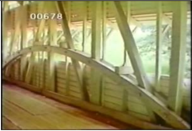
678、KRNT000415、不明橋、US、ペンシルバニア？、カバブリッジ、屋根付きの橋、トラスの片面を撮影、木製トラス橋、