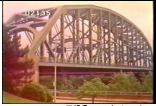
2135、KRNT000412、不明橋、US、ペンシルバニア、オーレンタウン？、斜めからほぼ全景、