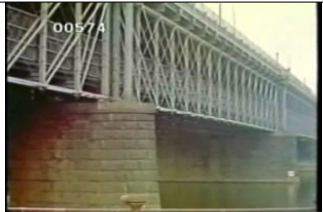
574、KRNT000406、不明橋、US、フィラデルフィア、な なめからほぼ全景を撮影、3径間、19世紀半ばに建 設、トラス橋