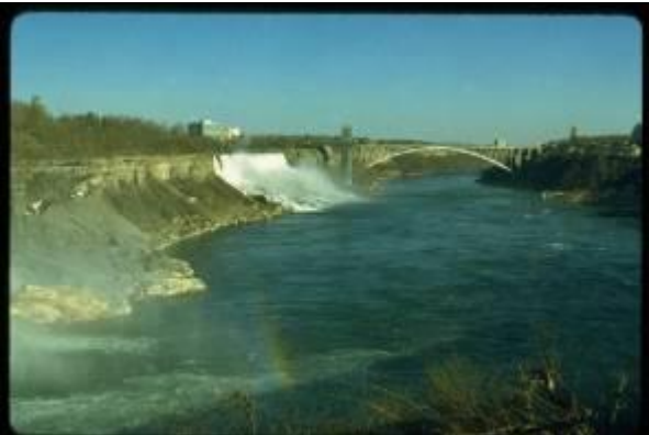
KRS061、レインボウ橋、US、バッファロー、固定鋼アーチ、1941、290m、ナイアガラ瀑布に架かる