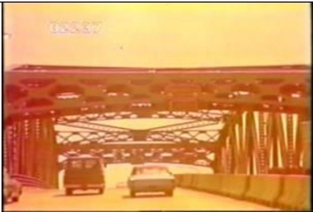
2237、KRNT000215、不明橋、US、ニューヨーク、タッパンゼー、路面上で橋のたもとで撮影、