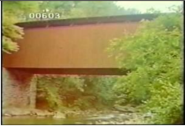
603、KRNT000418、不明橋、US、ペンシルバニア?、全景、カバーブリッジ、屋根付きの橋、色相:茶系の塗装、木製トラス橋、