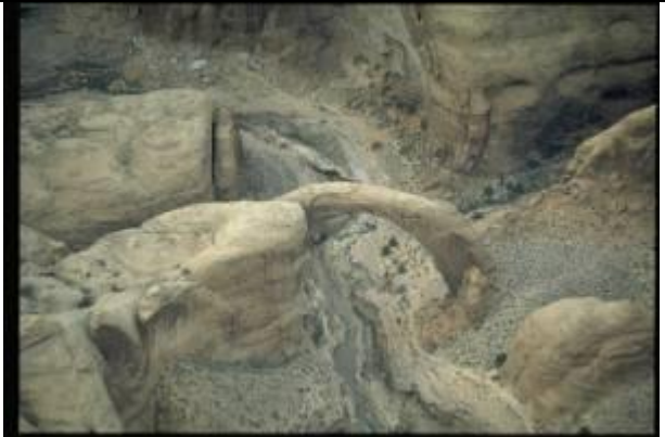
KRS001、天然アーチ、US、ユタ州、グランドキャニオンの奥に存在する