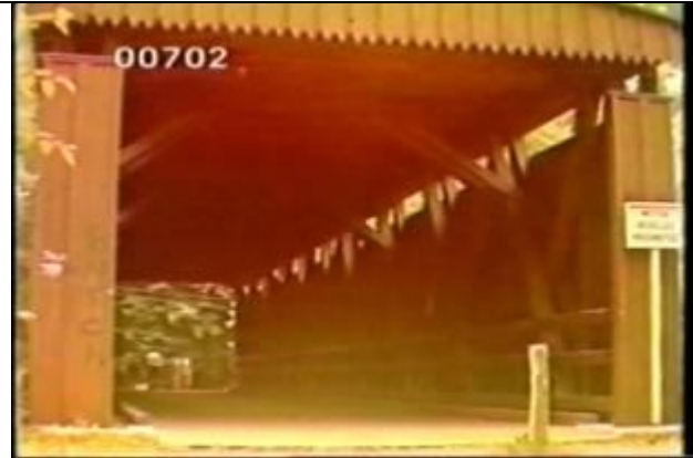
702、KRNT000417、不明橋、US、ペンシルバニア？、橋の入口附近の路上で撮影、カバブリッジ、屋根付きの橋、木製トラス橋