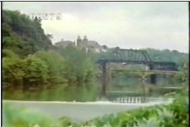
579、KRNT000404、不明橋、US、デラウエア、ほぼ全 景を撮影、遠景、トラス橋、