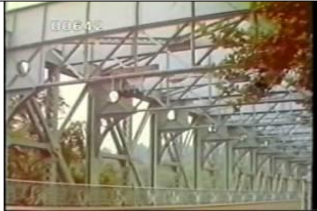
642、KRNT000401、フォール橋、US、フィラデルフィア、入口附近の路上で斜めにトラス片面と上横構を撮影、トラス橋