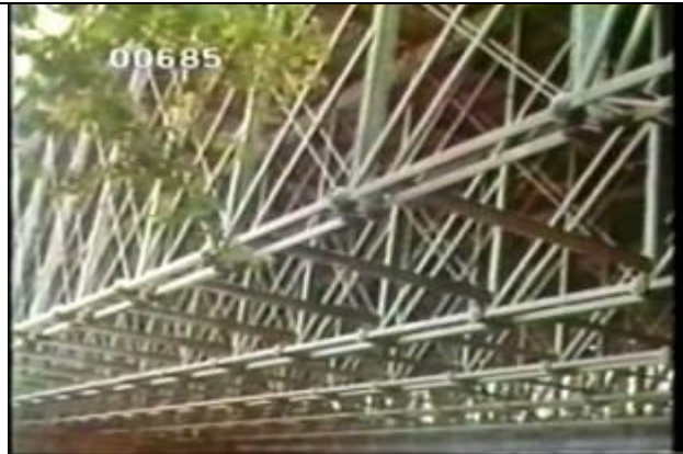
685、KRNT000407、不明橋、US、フィラデルフィア、トラス構造を近接撮影、トラス橋、