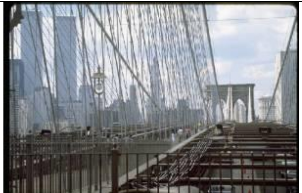
KRS077、ブルックリン橋、US、NY、吊橋、1883、389m、ピアノ線ケーブルによる最初の近代吊橋、レブリング父子の労作