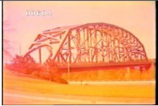
604、KRNT000216、不明橋、US、デラウェア、全景、トラス橋、