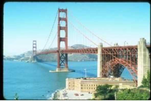
KRS078、ゴールデンゲイト橋、US、SF、吊橋、1937、1280m、シュトラウスの作