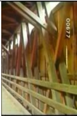
677、KRNT000414、不明橋、US、コロンブス、カバーブリッジ、屋根付きの橋、トラスの片面を撮影、木製トラス橋、