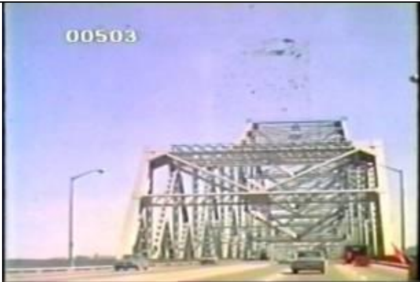
503、KRNT000510、不明橋、US、ニューヨーク、入口 附近で撮影、トラス吊橋