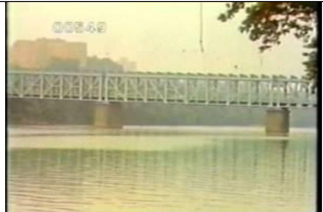
549、KRNT000403、フォール橋、US、フィラデルフィア、 ほぼ全景を撮影、3径間、遠景、トラス橋、