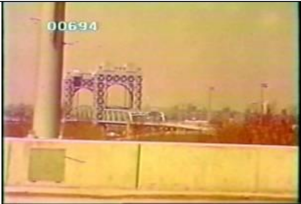
694、KRNT000704、不明橋、US、ニューヨーク、遠景、トラス橋、