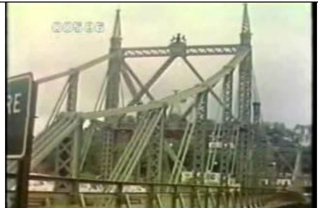
586、KRNT000410、不明橋、US、デラウエア川、橋の 入口附近で斜めから橋の全景を撮影、トラス橋、