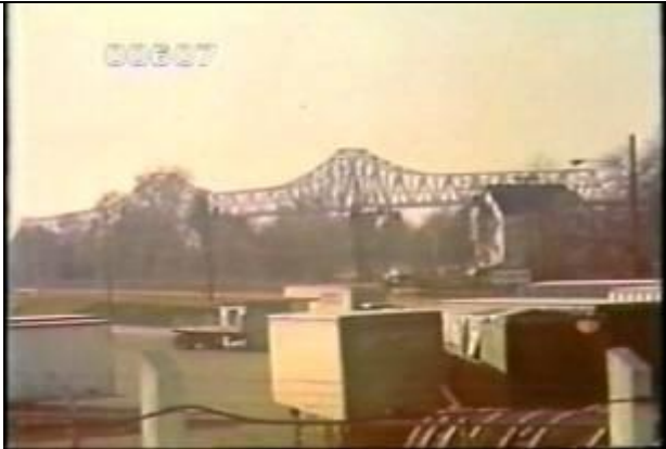
607、KRNT000514、不明橋、US、ニューヨーク、全景、遠景、トラス橋、