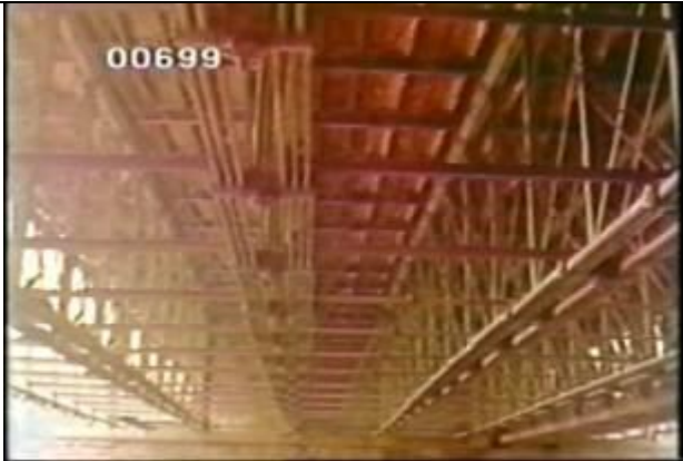
699、KRNT000409、不明橋、US、フィラデルフィア、橋の下からトラス構造を撮影、トラス橋、