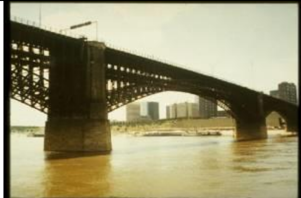
KRS047、イーツ橋、US、セントルイス、鋼アーチ、1874、3x153m、“最初の工業生産鋼によるアーチ、イーツ大佐による有料橋として架設”