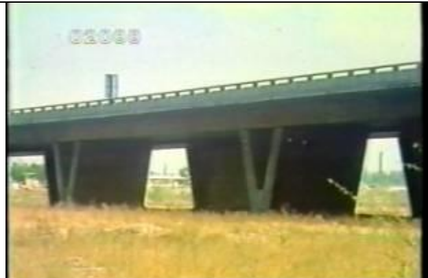
2088、YMD920713、不明橋、CN、芦溝橋近くの高速度道路、19900400