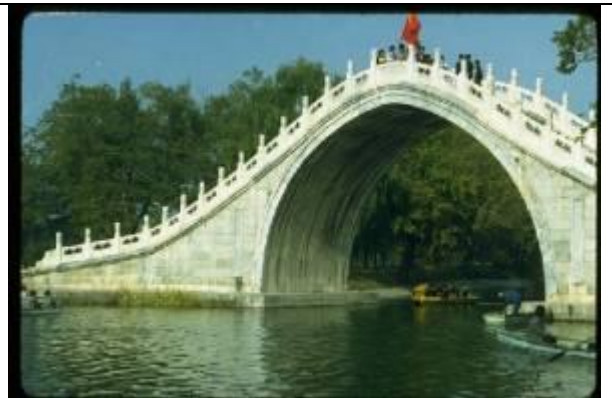
KRS043、玉帶橋、CN、北京、石造アーチ、1736、北京夏宮(頤和園)内にある典型的中国式アーチ