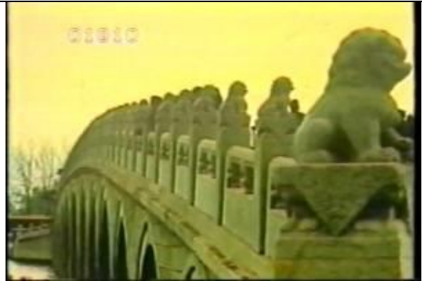
1810、YMD920804、十七孔橋、CN、欄干の獅子、頤和園の中にある橋、19900400