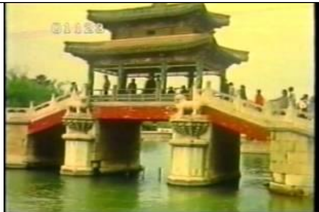
1123、YMD920613、こう橋、CN、頤和園の中にある橋、19900400