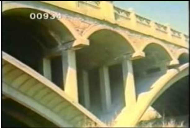
934、YMD920714、新芦溝橋、CN、アーチ部、19900400