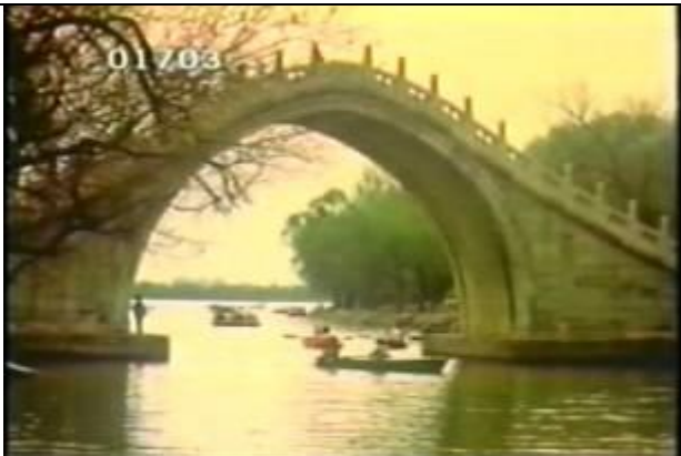
1703、YMD920616、玉帯橋、CN、頤和園の中にある橋、19900400