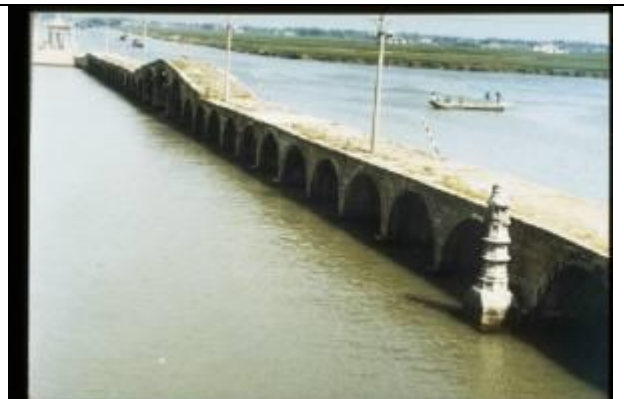
KRS042、宝帯橋、CN、蘇州、石造アーチ、唐 819、“3.9-6.9m、53 径間、全 317m”、船引き橋