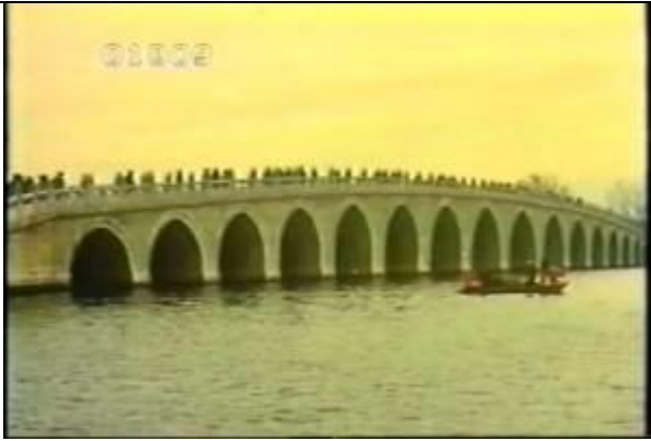
1809、YMD920802、十七孔橋、CN、頤和園の中にある橋、19900400