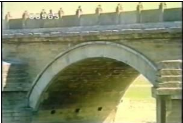
963、YMD920607、盧溝橋、CN、盧溝橋(芦溝橋):アーチと橋脚、上流側には鉄の楔状の水切りがある、19900400