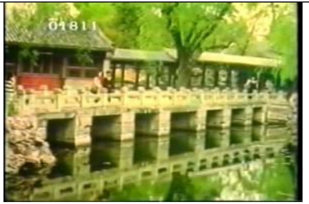
1811、YMD920805、十七孔橋、CN、頤和園の中にある橋、19900400