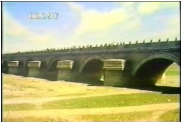
2296、YMD920602、盧溝橋、CN、盧溝橋(芦溝橋):、19900400