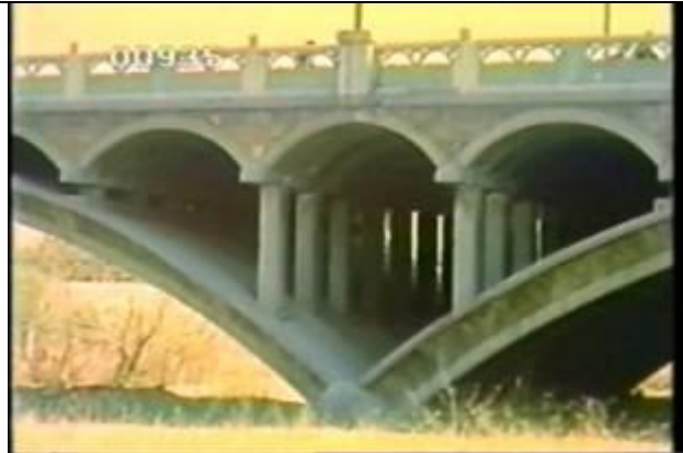
935、YMD920710、新芦溝橋、CN、アーチ部、19900400