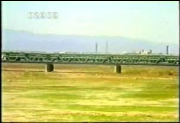
2303 2298、YMD920611、盧溝橋、CN、盧溝橋(芦溝橋) : 下流にある文化革命当時の新芦溝橋、19900400