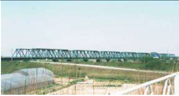
T100351、第二最上川橋梁上り線、山形県、余目市、最上川、羽越本線、1960