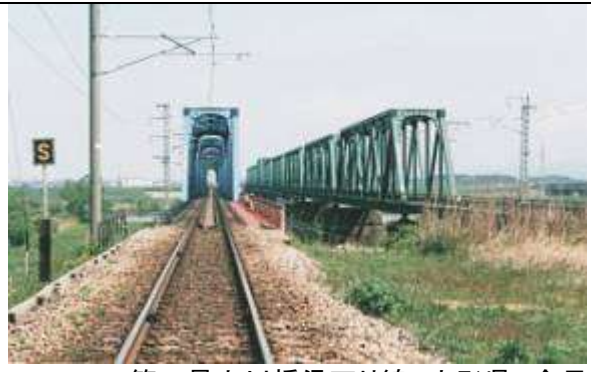
T100291、第二最上川橋梁下り線、山形県、余目市、最上川、羽越本線、1959