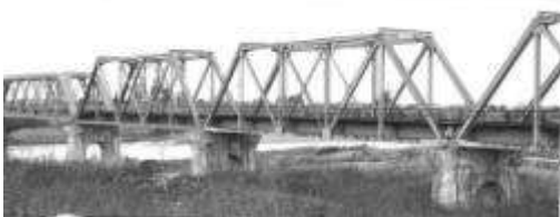
T20041、最上川橋梁、山形県、中山町、寒河江市、最上川、1959