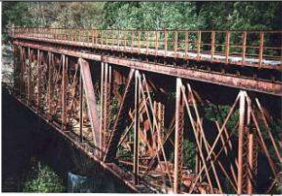
T60041、八敷代川橋梁、山形県、真室川町、八敷代川、国鉄奥羽本線、1904