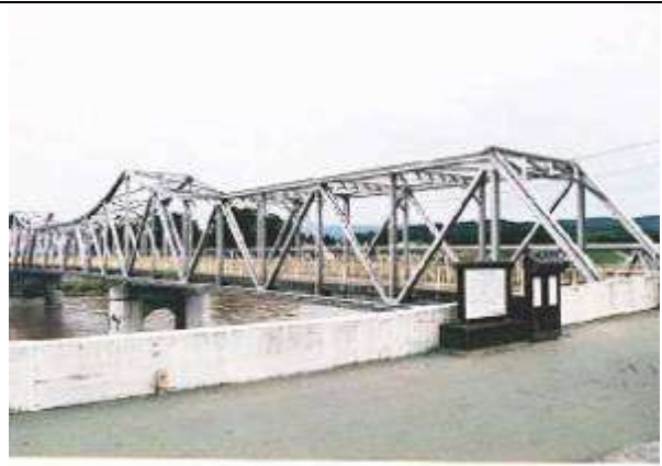
T90131、(大石田)大橋、山形県、大石田町、最上川、国道 347 号、1930