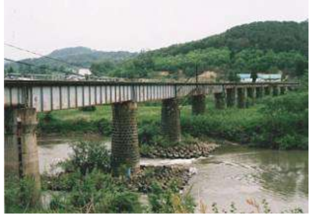
G20181、松川橋梁、山形県、南陽市、川西町、最上川、1914