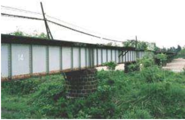
G20171、白川橋梁、山形県、長井市、置賜白川、米坂線、1914