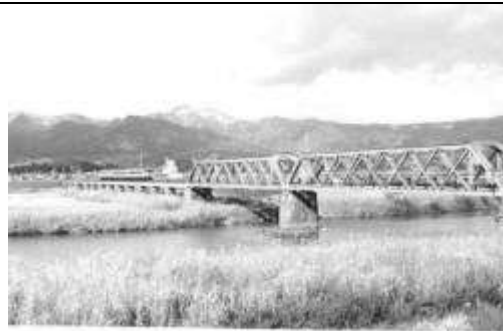
T20051、最上川橋梁、山形県、白鷹町、最上川、山形鉄道、1923