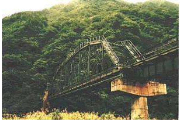
T20211、第四荒川橋梁、山形県、小国町、荒川、米坂線、1968