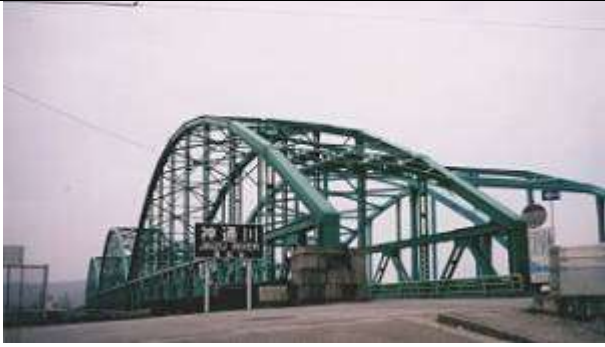
A70171、神通大橋、富山県、富山市、神通(じんづ)川、県道小竹諏訪川原線、1956