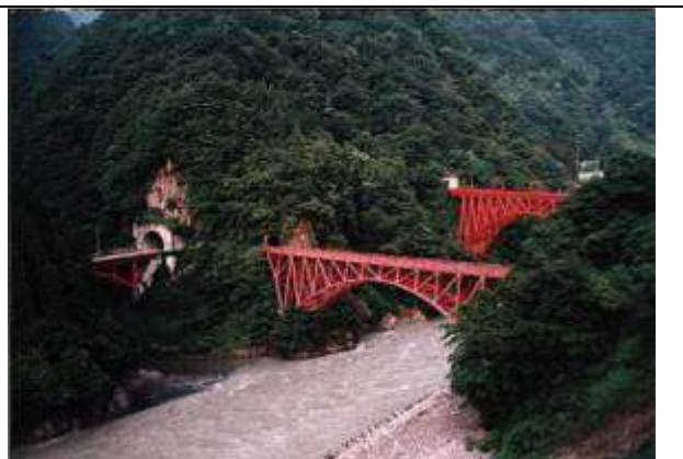
A10021、(旧)山彦橋(黒部橋)、富山県、宇奈月町、黒部川、黒部峡谷鉄道、1926