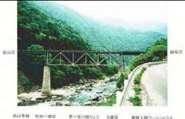
T51221、第二宮川橋梁、富山県、細入村、宮川村、宮川、1931