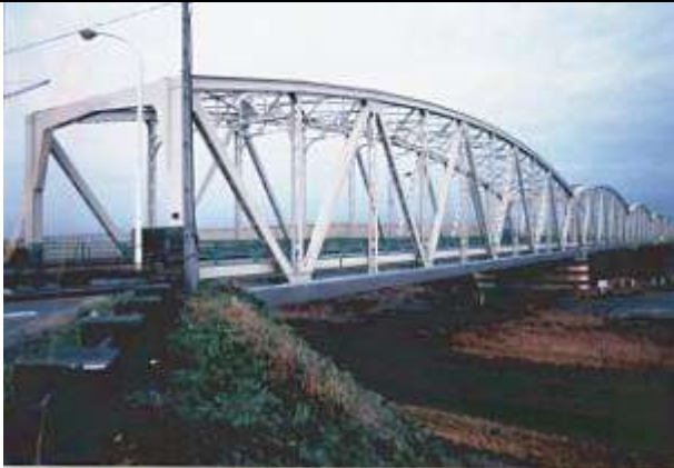
T110081、常願寺大橋、富山県、富山市、常願寺(じょうがんじ)川、国道8号、1952