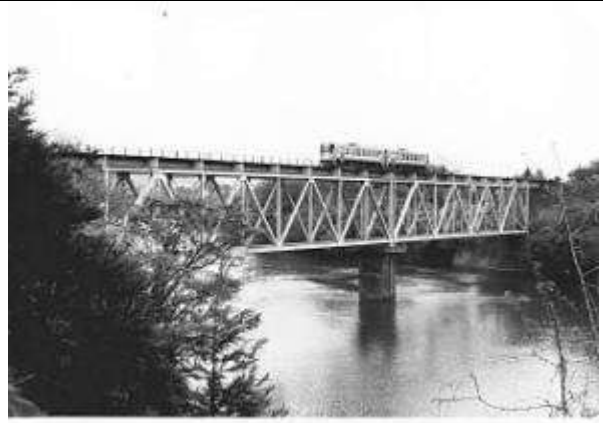
T51121、第二神通川橋梁、富山県、細入村、大沢野町、神通川、1930