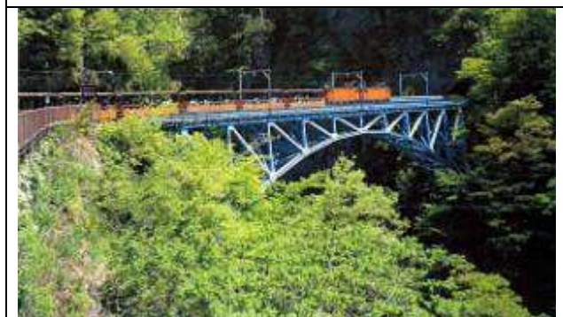
A10041、後曳橋、富山県、宇奈月町、黒薙(くろなぎ)川、黒部峡谷鉄道、1926