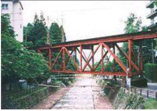
T50523、宇奈月川橋梁、富山県、宇奈月町、宇奈月川、富山地方鉄道本線、1923