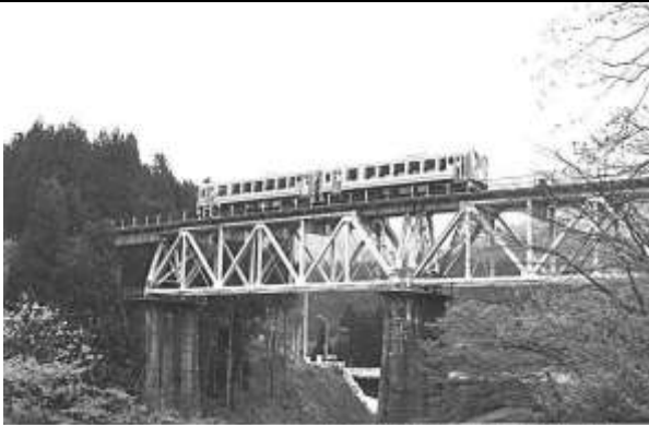
T51201、猪谷川橋梁、富山県、細入村、猪谷川、高山本線、