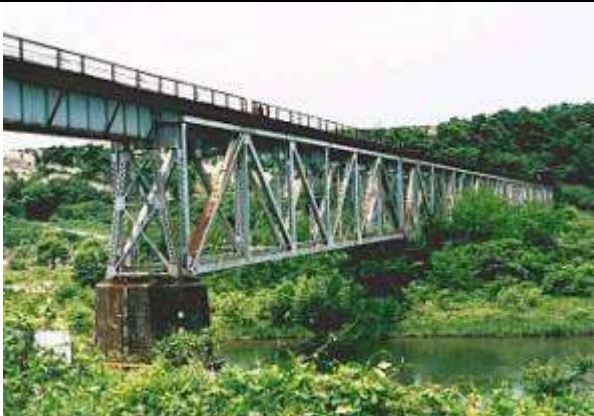
T50172、第一神通川橋梁、富山県、大沢野町、八尾町、神通川、1929