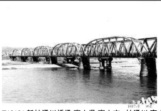
T10101、新神通川橋梁、富山県、富山市、神通川、高山本線、1908、