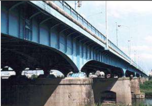
G70321、富山大橋 (旧橋名新大橋)、富山県、富山市、神通川、県道(建設時国道11号)、1936