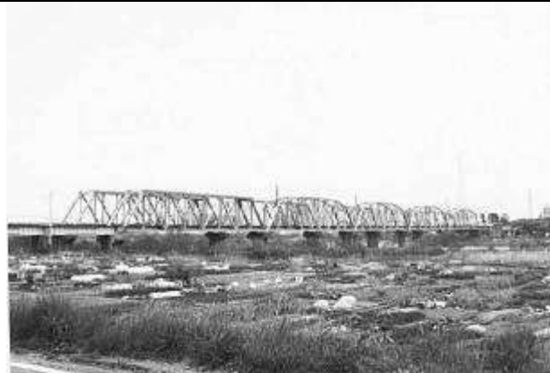
庄川橋りょう 上り線 全景 ①TTR568-1 ②TTR568-1 3④⑤TTR562-1 T50364、庄川橋梁上り線、富山県、大門町、庄川、北陸本線、1963