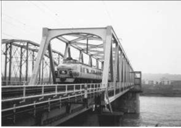
T100362 新神通川橋梁,富山県,富山市、神通川,北陸本線 1959