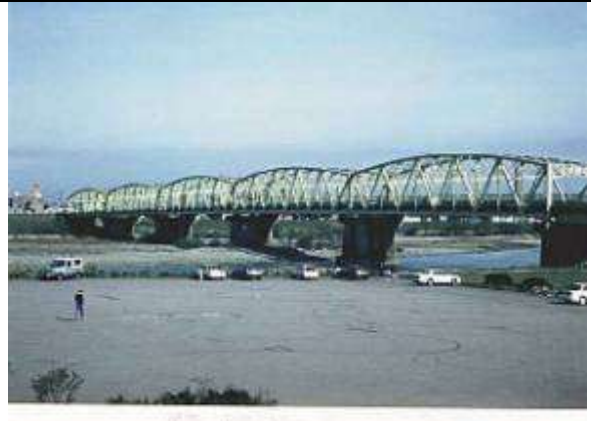
T90981、高岡大橋(工事名・雄神橋)、富山県、高岡市、庄川、県道(建設時 国道8号線)、1938