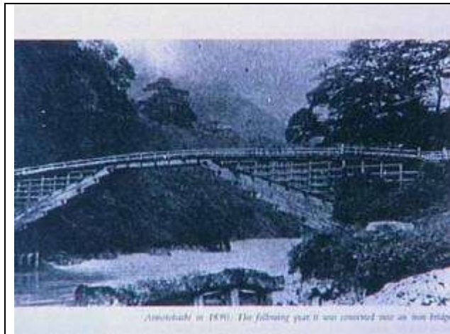
SMDJAPB057 愛本橋日本3名橋の一つ。The EAST Vol.29-6,1994 より 1890????