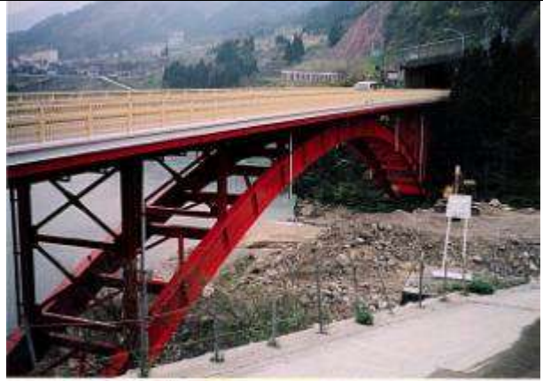
A70211、猪谷橋、富山県、細入村、猪谷(いのたに)川、国道41号、1958