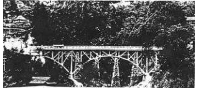
A50311、棚沢橋、東京都、西多摩郡奥多摩(おくたま)町(古里村)、県道青梅・甲府線(架設当時)現・国道411号、1932