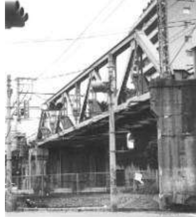
T50731、山手線跨線線路橋、東京都、渋谷区、(山手線)、東京急行電鉄/東横線、1927