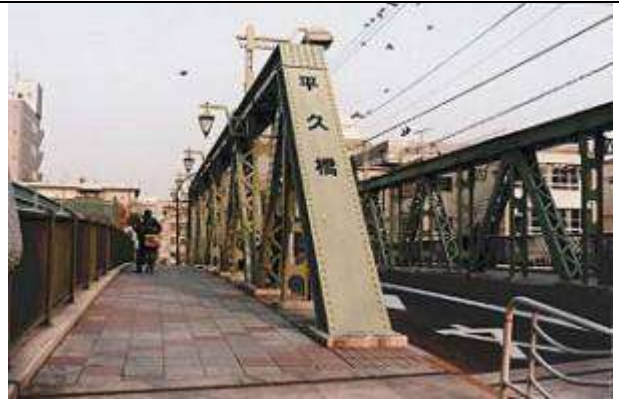
T90433、平久橋、東京都、江東区、平久川、ポ二一、