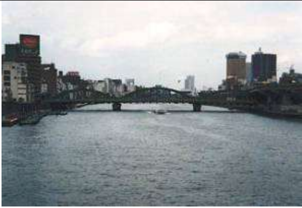
A50151、厩橋、東京都、台東区駒形・蔵前～墨田区本所、隅田(すみだ)川、春日通り(補助 102 号線)、1929