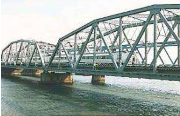
常磐線隅田川橋梁 T50742、隅田川橋梁、東京都、荒川区、足立区、隅田川、1928