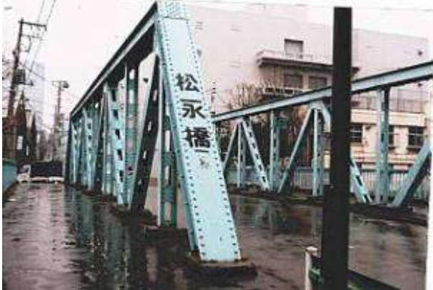
T90393、松永橋、東京都、江東区、大島川西支川、区道第 3021 号線、1929