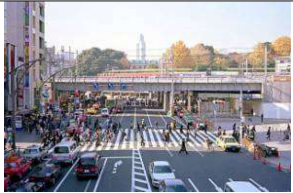
G30041、上野大通架道橋第 6、東京都、台東区、(中央通り)、1930