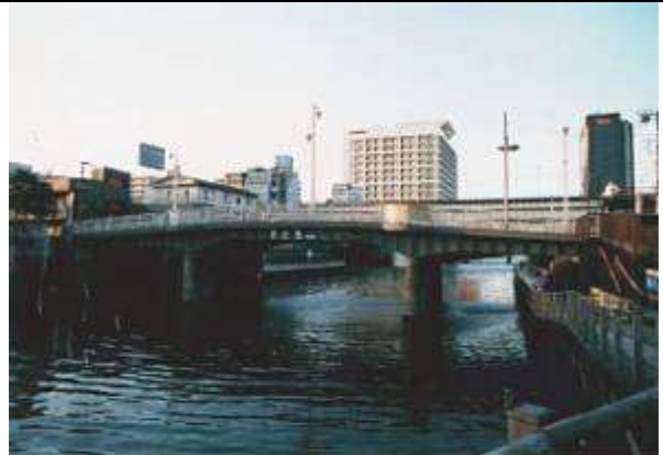
G70361、小石川橋、東京都、千代田区、神田川、中路ダブルウェブ板桁、

1999年 10月 作成 1999年 12月 11日 作成 藤井 郁夫