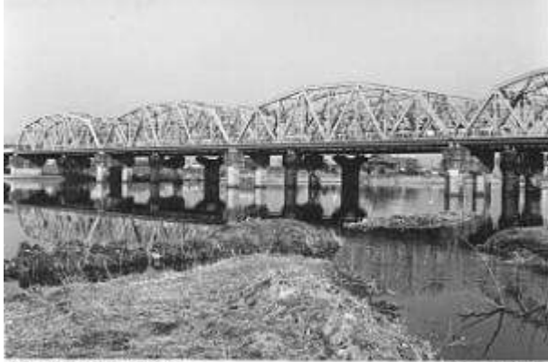
東北本線荒川橋梁(貨物線) T50711、荒川橋梁旅客線、あらかわ、東京都、北区、1927