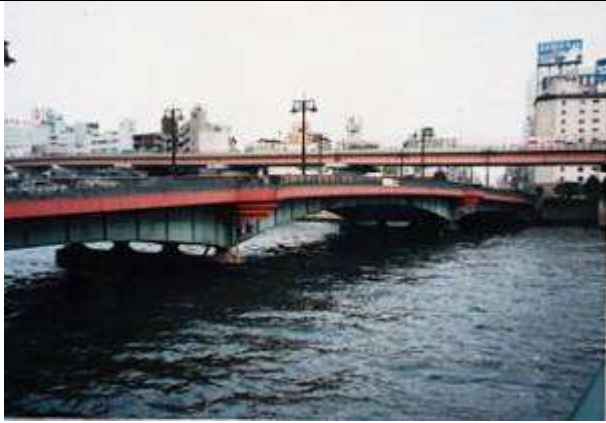
G70171、両国橋、東京都、中央区～墨田区、隅田川、靖国通り(国道 14 号)、1932