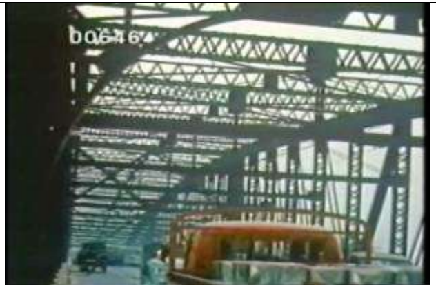
646、KRNT000302、旧大橋？、JP、東京、隅田川、路面上でトラス組を撮影、トラス橋