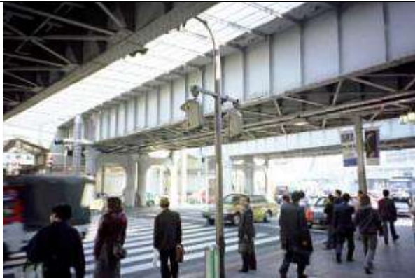
G20711、上野大通架道橋第 4、東京都、台東区、(中央通り)、1929