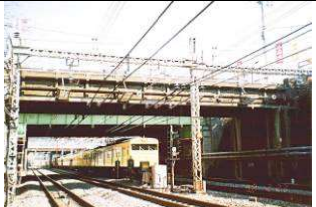
G40212、中野跨線道路橋、東京都、中野区東中野、(中央本線)、中野区区道、1924