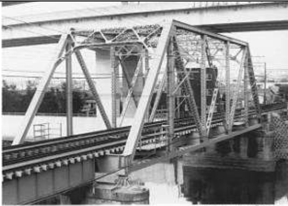
T51271、綾瀬川橋梁、東京都、葛飾区、綾瀬川、京成電鉄/本線、1931