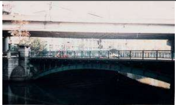
A50061、雉子橋、東京都、千代田区、日本橋(にほんばし)川、区道、1927