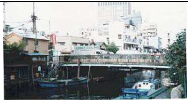
作成年月日 1995・11・17 作成者名 平原 勉 G70081、巽橋、東京都、江東区永代、大島川西支川、区道、1929