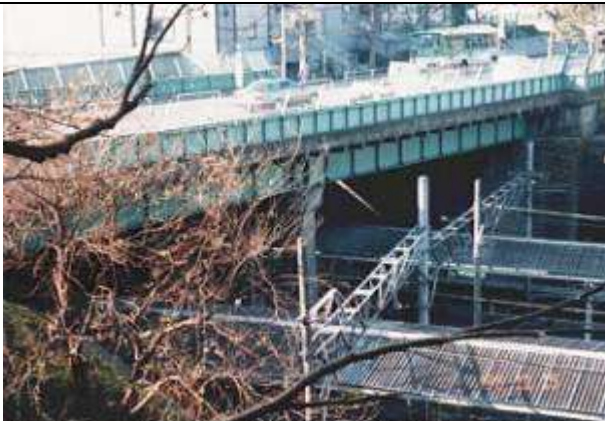
成年月日 1995・11・17 作成者名 平原 勉 G70091、新四谷見附橋、東京都、千代田区、(JR 東日本中央本線四ツ谷駅)、区道、1929