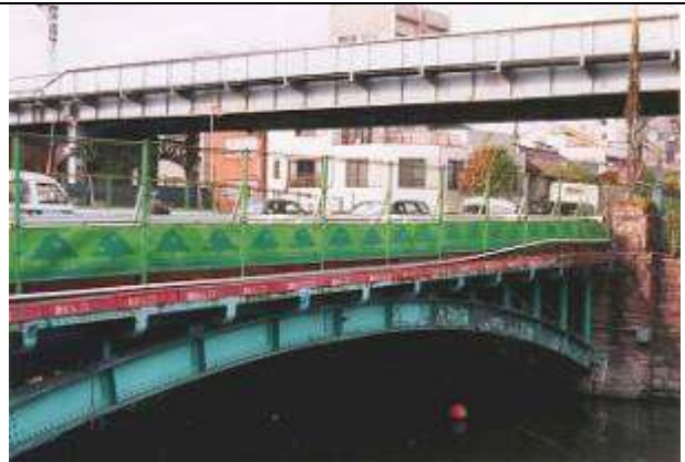
A50121、源森橋、東京都、江東区、源森(げんもり)川、区道、1928