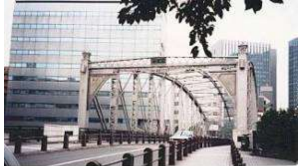
作成年月日 1995・11・17 作成者名 平原 勲