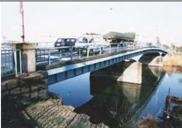
1999年10月 作成1999年12月11日 作成 藤井 郁夫