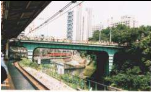
平成13年6月