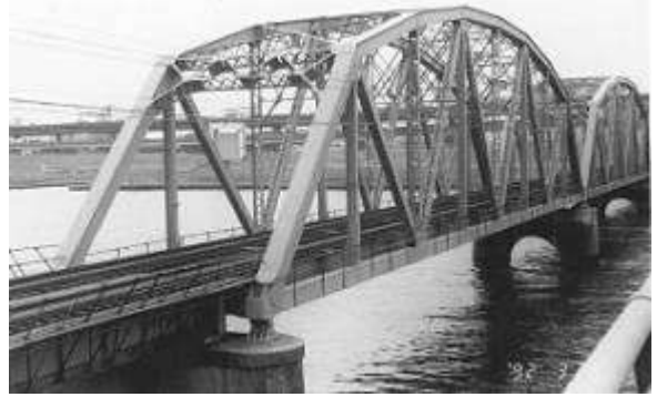
T51251、荒川放水路橋梁、東京都、足立区、葛飾区、荒川(放水路)、1931