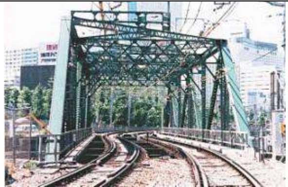
T51341、八ツ山跨線線路橋、東京都、品川区、東海道本線、京浜急行/本線、1933