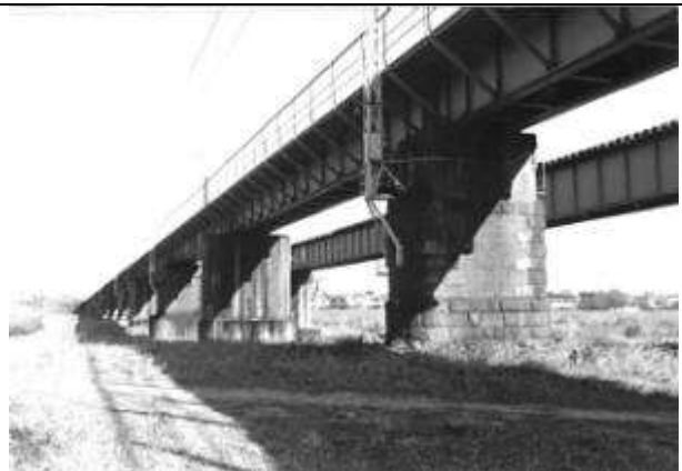
G10011、多摩川橋梁(上り)、東京都、立川市～日野市、多摩(たま)川、中央本線、1889