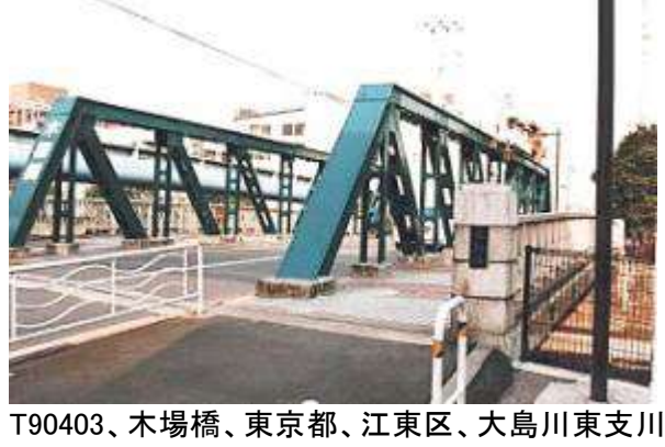
T90403、木場橋、東京都、江東区、大島川東支川、区道第 3412 号線、1929