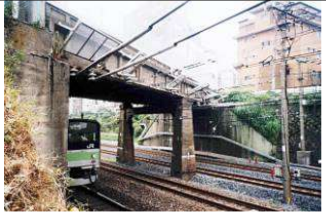
G40193、染井橋跨線道路橋、東京都、北区駒込、(山手線・山手貨物線)、区道、1925