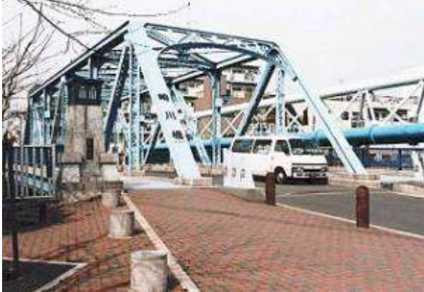
T90413、崎川橋、東京都、江東区、仙台堀川、区道第 3126 号線、1929