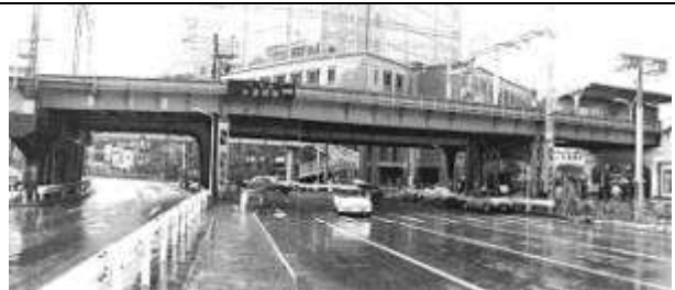
G10231、新水道橋架道橋、東京都、千代田区、<白山(通り)>、中央本線、