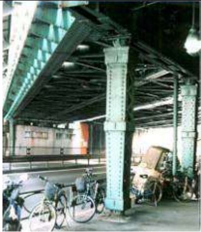
G40171、源助橋架道橋、東京都、港区、(国道 15号)、東海道本線、1941