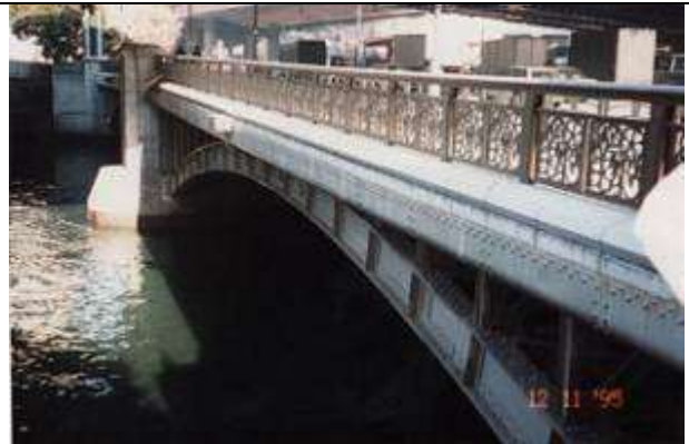
A50181、江戸橋、東京都、中央区日本橋(にほんばし)、日本橋(にほんばし)川、主要地方道 316 号線、1929