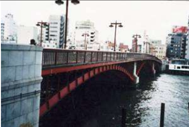
A50283、吾妻橋、東京都、台東区雷門・花川戸～墨田区吾妻橋、隅田(すみだ)川、補助102号線、1931