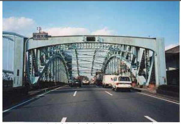
A50021、千住大橋、東京都、荒川区～足立区、隅田川、日光街道(国道 4 号)、1927