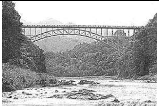
A50621.、奥多摩橋、東京都、青梅(おうめ)市、多摩(たま)川、主要地方道、1939