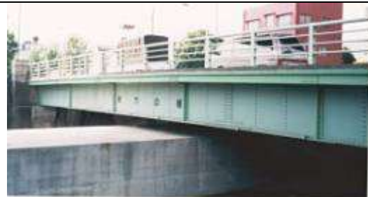
撮影 平成3年9月18日 成瀬 輝男

G90151、新六の橋、東京都、江東区、旧豎川(埋め 立てられボックスカルバート)、都道(都市計画街路 補助 144 号線)、1955