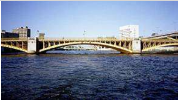
A50083、蔵前橋、東京都、台東区蔵前～墨田区横綱、隅田川、蔵前橋通り(放射 14 号)、1927