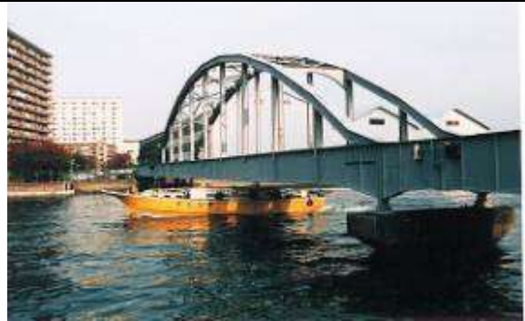
A60011.、豊洲橋梁、東京都、江東区福浜、豊洲運河、東京都専用線、1953