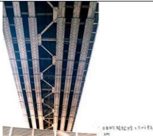
G40162、昭和橋架道橋、東京都、千代田区、(昭和通り)、総武本線、1932