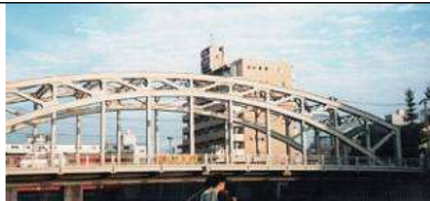
A50231、万年橋、東京都、江東区常磐(ときわ)～清澄(きよずみ)、小名木(おなぎ)川、区道第 3124 号線、1930