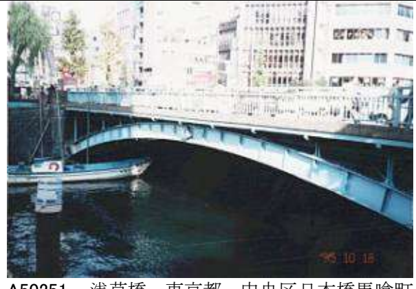
A50251、浅草橋、東京都、中央区日本橋馬喰町～台東区柳橋、神田(かんだ)川、台東区道、1930