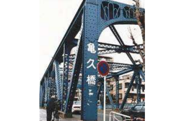
T90423、亀久橋、東京都、江東区、仙台堀川、区道 3125 号線、1929