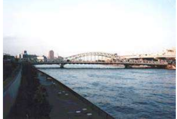
A50271、白鬚橋、東京都、墨田区堤通り～荒川区南千住、隅田(すみだ)川、明治通り、1931