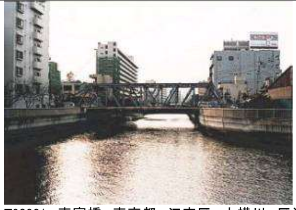
T90381、東富橋、東京都、江東区、大横川、区道 3125 号線、1930