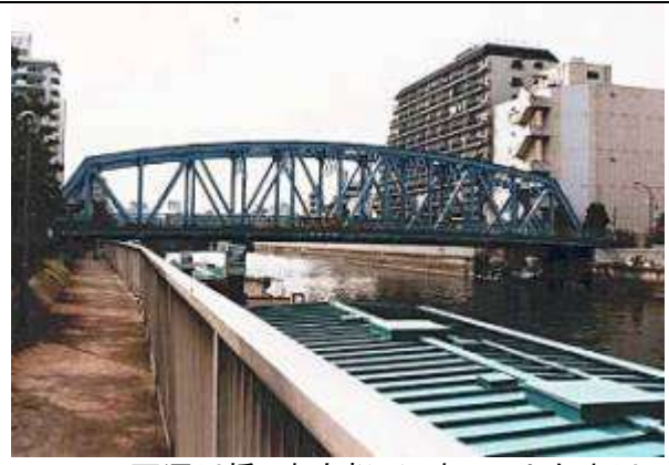
T90321、西深川橋、東京都、江東区、小名木川、区道第 3009 号線、1930