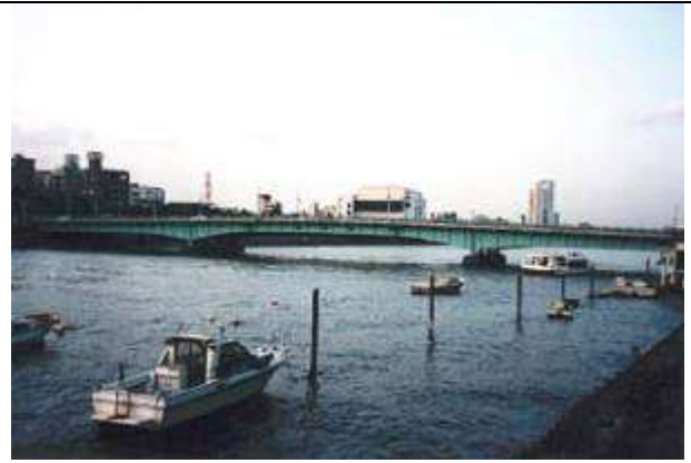
G70051、言問橋、東京都、台東区～墨田区、隅田川、環状 3 号線、1928