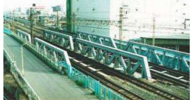
東北本線第二日暮里跨線線路橋 T50891、第二日暮里跨線線路橋、東京都、荒川区、常磐貨物線、東北本線、1929