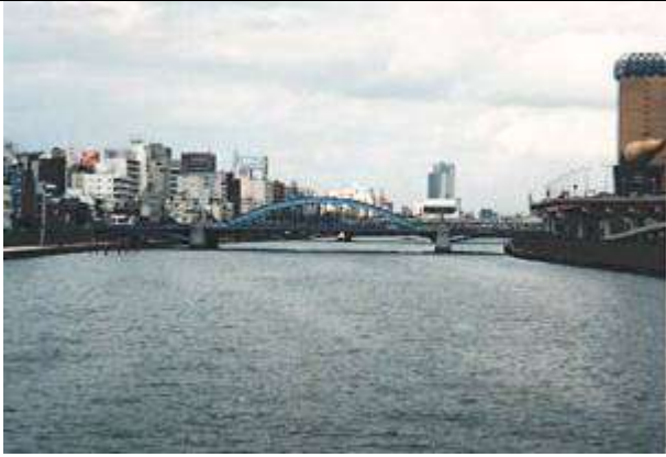
A50031、駒形橋、東京都、台東区～墨田区・吾妻橋、隅田川、浅草通り(補助 103 号線)、1927