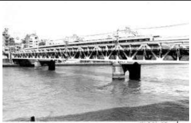
T50201、隅田川橋梁、東京都、台東区・墨田区、隅田川、東武鉄道伊勢崎線、1931