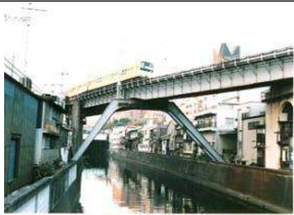
G40101、神田川橋梁、東京都、千代田区、神田川、総武本線、1932