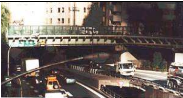
作成年月日 1995・11・17 作成者名 平原 勉 G70071、三吉橋、東京都、中央区銀座、首都高速道路元築地川、楓川、中央区道、1929