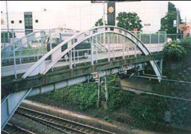
A50661.、眼鏡橋、東京都、立川市、(中央本線立川一日野間)、立川市道南 119 号、1935