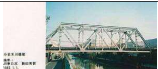
小名木川橋梁 1927.1.1. T50921、小名木川橋梁、東京都、江東区、小名木川、越中島線、1929