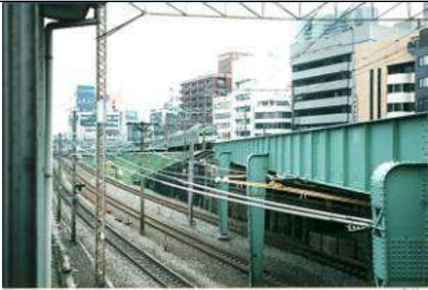
G40091、淀橋跨線線路橋、東京都、新宿区、(中央本線)、山手線、1922