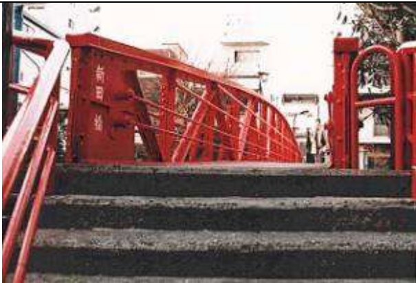
T90473、新田橋、東京都、江東区、大横川、区道第1180号線、1932