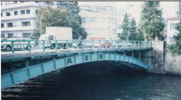
A50171、美倉橋、東京都、千代田区神田和泉町～同東神田、神田(かんだ)川、区道、1929