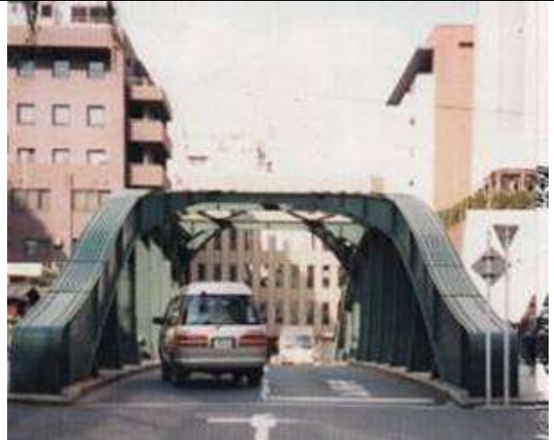
A50162、柳橋、東京都、中央区東日本橋～台東区柳橋、神田(かんだ)川、台東区道第 1 号線、1929