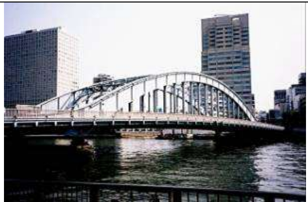
A40073、永代橋、東京都、中央区～江東区、隅田(すみだ)川、1926