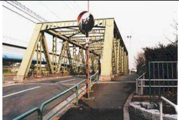
T90463、鶴歩橋、東京都、江東区、平久川、区道第3412号線、1928