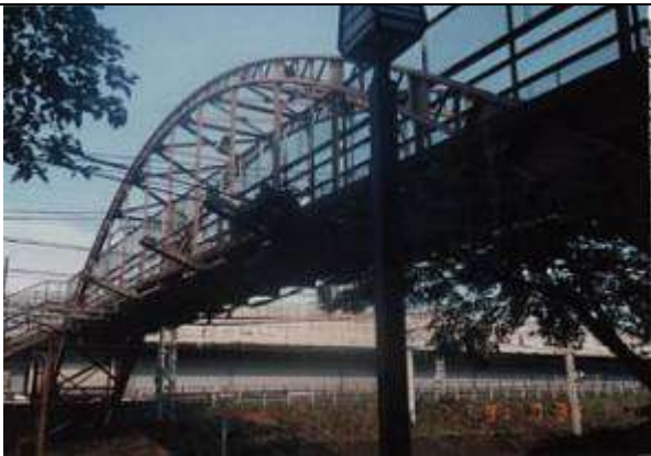
A40061、飛鳥山下人道跨線橋、東京都、北区王子、(東北本線)、中路固定ブレースドリブアーチ、