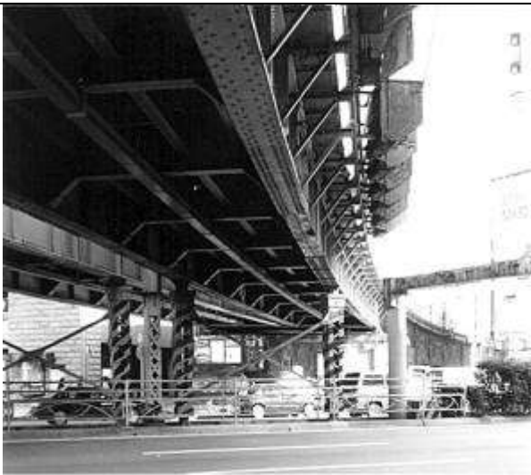
G40142、万世橋架道橋、東京都、千代田区、(中央通り)、中央本線、1928