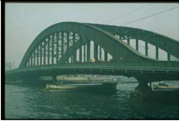
KRS068、永代橋、JP、東京、タイドアーチ、1926、100.6m、高張力鋼使用