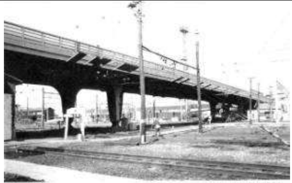
G70263、田端大橋、東京都、北区、(JR 東日本田端操車場)、 \pi 形ラーメン板桁(中央径間ヒンジ付)、1935