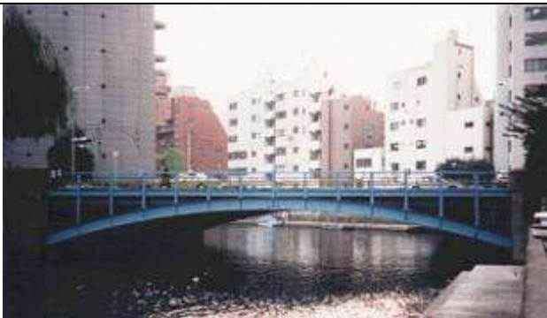
A50191、亀島橋、東京都、中央区八丁堀～新川、亀島(かめじま)川、中央区道第 401 号線、1929