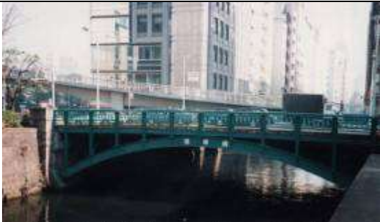
A50A50051、後楽橋、東京都、千代田区文京区、神田(かんだ)川、中央区道第 490 号線、1927051