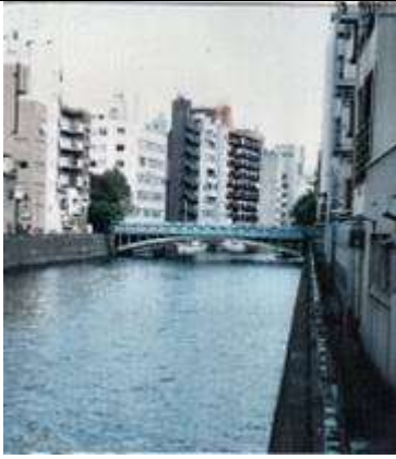
A50241、左衛門橋、東京都、台東区区浅草橋～同千代田区東神田、神田(かんだ)川、千代田区道、1930