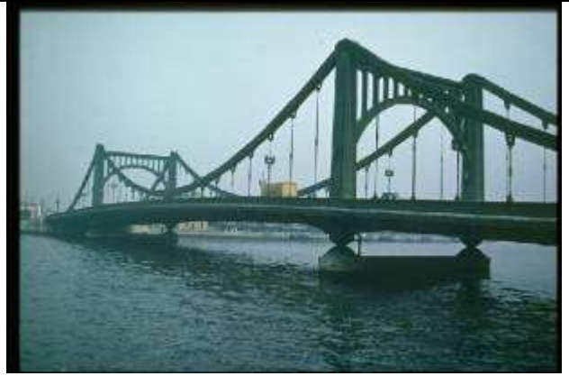
KRS083、清洲橋、JP、東京、チェーン吊橋、1928、186.2m、戦前のケルンに同形の吊橋があった