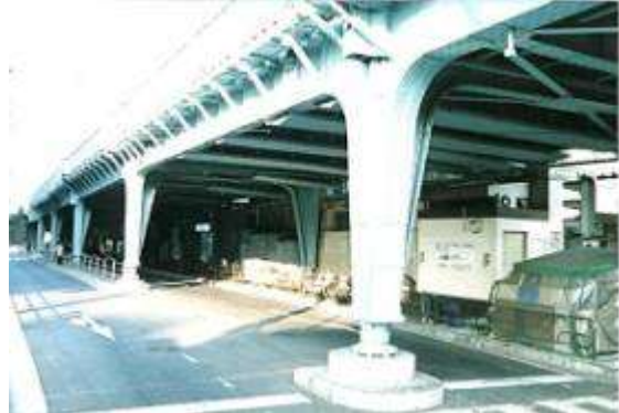
G40121、水道橋架道橋(急行線)、東京都、千代田区、(白山通り)、中央本線、1933