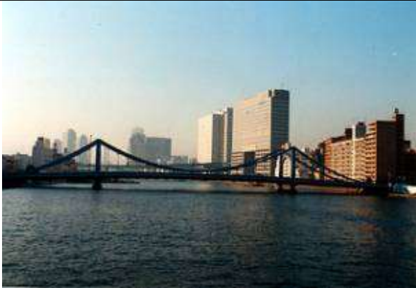
S30011、清洲橋、東京都、中央区～江東区、隅田川、清洲橋通り、1928