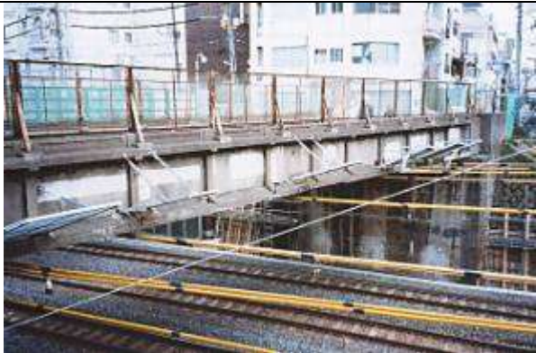
G40202、江戸橋跨線道路橋、東京都、豊島区巢鴨、(山手線)、豊島区区道、1925