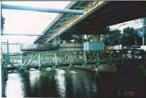
2000年2月2日 作成 2000年2月11日 作成 森井 郁夫