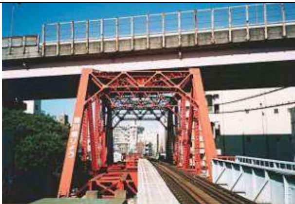
豎川橋梁 1927.1.1. T50912、豎川橋梁、東京都、江東区、豎川(埋立済)、越中島線、1929