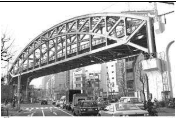
A20041、松住町架道橋、東京都、千代田区、(不忍(しのばず)通)、総武線、1932