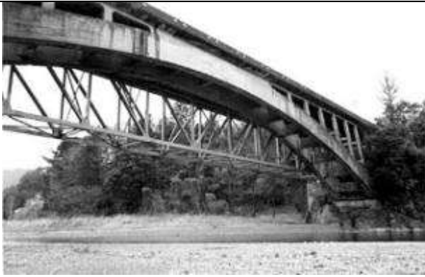
A30041、万年橋、東京都、青梅市、多摩(たま)川、国道 411 号、1907