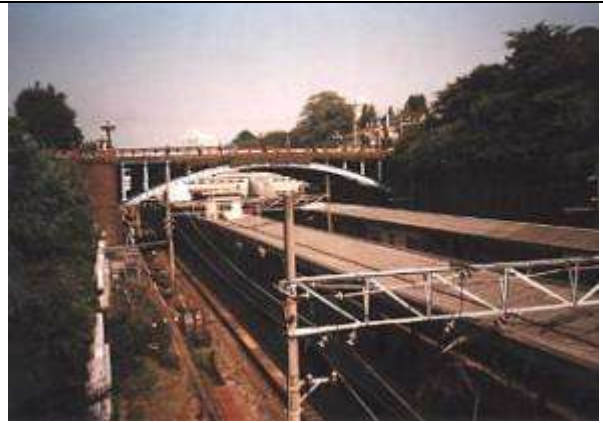
A40021、長池見附橋(旧四谷見附橋)、東京都、八王子市別所長池地区、姿池上、移設後多摩ニュータウン内コミュニティ・コレクターリンク道路((旧) 国道 20 号)、1993