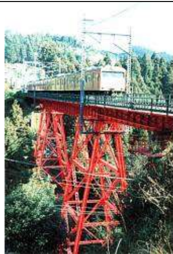
G40051、奥沢橋梁、東京都、青梅市、奥沢、青梅線、1929