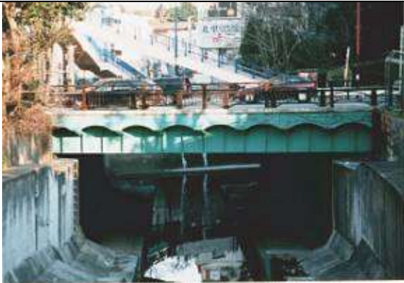
1999年10月 作成1999年12月11日 作成 藤井 郁夫