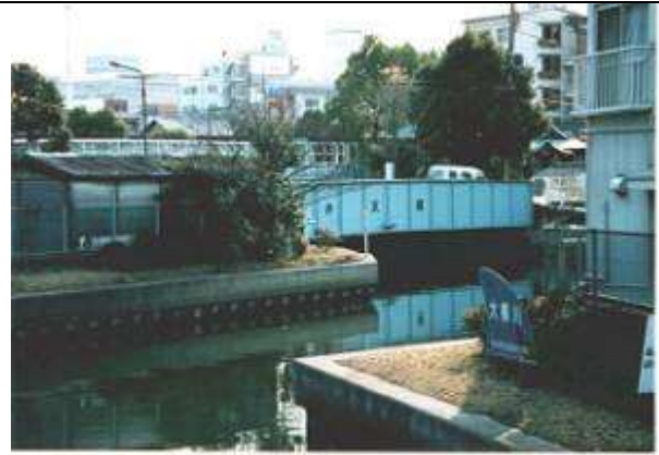
1999年10月 作成1999年12月11日 作成 藤井 郁夫