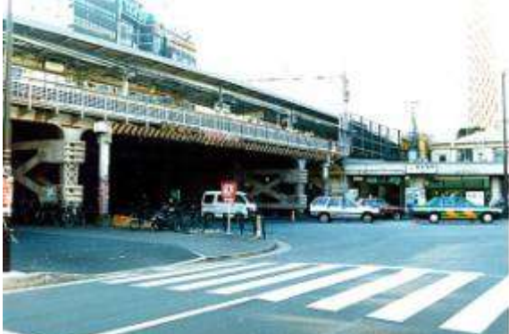
G40111、飯田橋通り架道橋、東京都、千代田区、(目白通り)、中央本線、1926