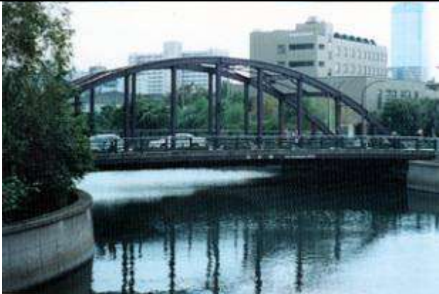
A50612.、白妙橋、東京都、江東区塩浜(しおはま)、平久(ひらく)運河、区道第 3145 号線、1937