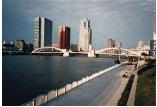
M30331、勝鬨橋、東京都、中央、隅田川、晴海通り(放射34号線)、1940