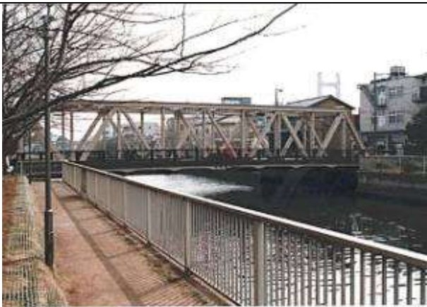
作成(改訂)年月日:960313 作成(改訂)者名:伊東孝