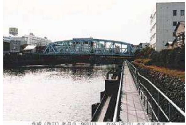
作成(改訂)年月日:960313 作成(改訂)者名:伊東孝