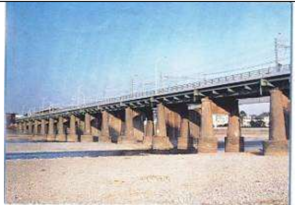
G60131、二子橋、東京都、世田谷区～川崎市、多摩川、国道 246 号、1925