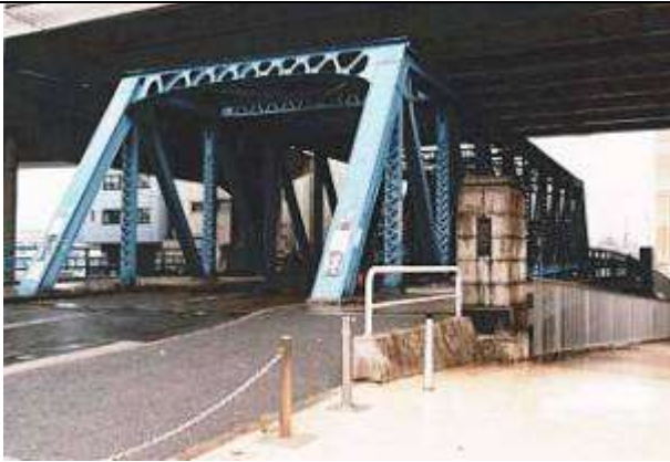
T90453、松本橋、東京都、墨田区～江東区、豎川、墨田区道、1929