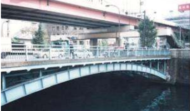
A50261、和泉橋、東京都、千代田区東神田～同神田和泉町、神田(かんだ)川、国道第6号線、1930