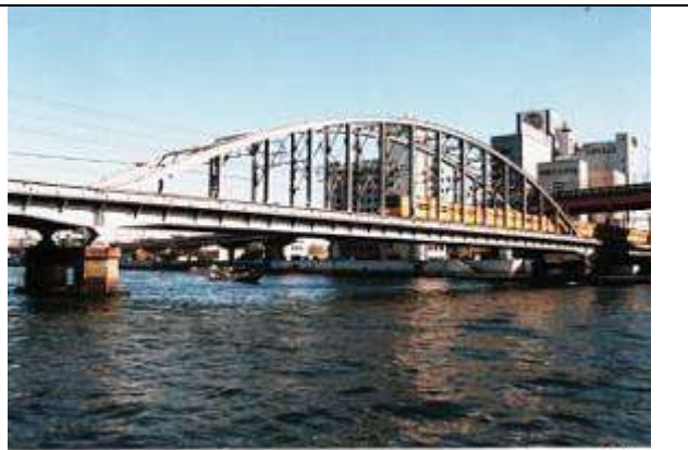
A20051、隅田川橋梁、東京都、台東区～墨田区、隅田(すみだ)川、総武線、1932