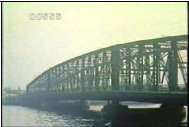
555、KRNT000301、旧大橋、JP、東京、隅田川、斜からほぼ全景を撮影、トラス橋、