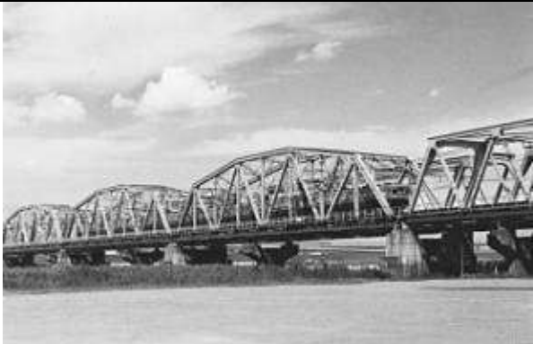
T50431、荒川放水路橋梁下り線、東京都、足立区、荒