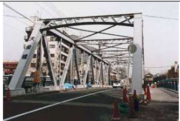
T90363、大栄橋、東京都、江東区、大横川、区道第 3020 号線、1929