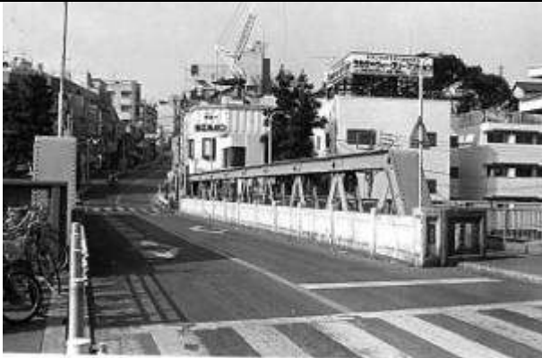
T30131、十条跨線橋、東京都、北区、(東北本線東十条駅)、ポニーワーレン(ピン結合)、