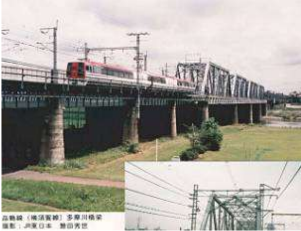
高橋線(横須賀線)多摩川橋梁