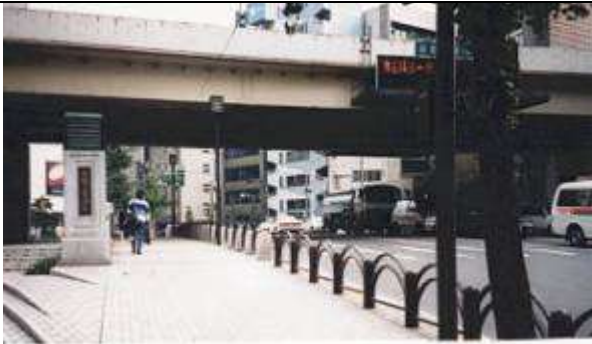
作成年月日 1995・11・17 作成者名 平原 勉 G60171、弾正橋、東京都、中央区京橋～八丁堀、首都高速道路(元築地川)、中央区道第 402 号線、1924