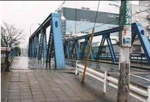
T90443、平川橋、東京都、墨田区、大横川、墨田区道、1929