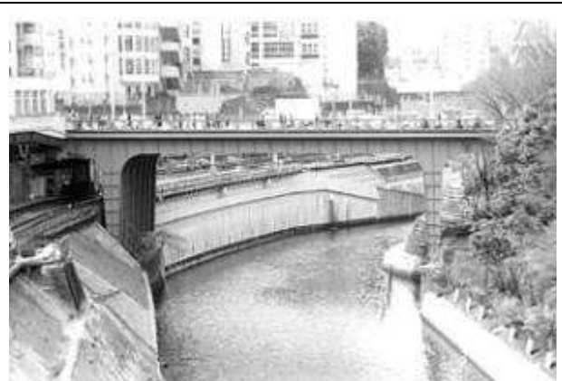
G70151、お茶の水橋、東京都、千代田区～文京区、神田川、JR 中央線、1931