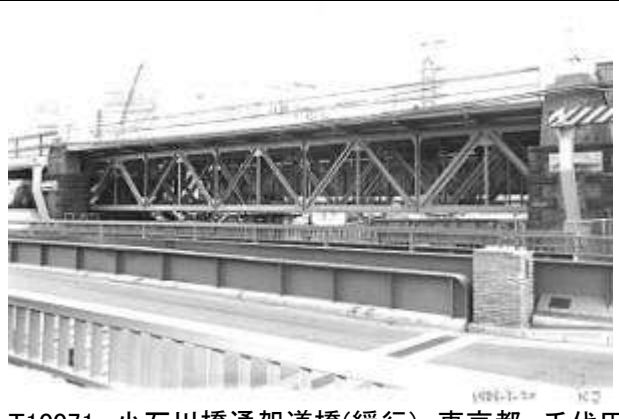
T10071、小石川橋通架道橋(緩行)、東京都、千代田区、日本橋川、中央本線(緩行上下線)、1904