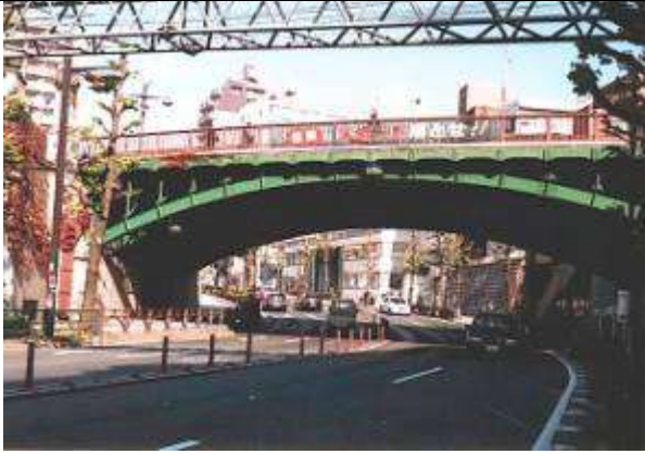
A50431.、千登世橋、東京都、豊島区目白、明治通り(跨道橋)、都道、1932