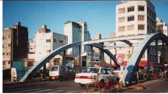
A50041、海幸橋、東京都、中央区築地、築地川東支川(つきじがわひがしせん)、中央区道第 490 号線、1927