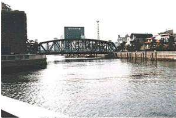
作成(改訂)年月日:960313 作成(改訂)者名:伊東孝