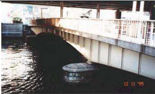
作成年月日 1995・11・17 作成者名 平原 勲 G60121、西河岸橋、東京都、中央区日本橋、日本橋川、区道、1925