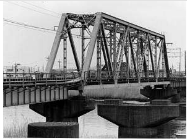
1989-5-3 No.1-12 1P112号一