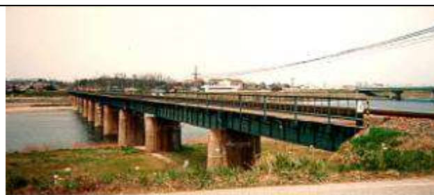
G20021、高津川橋梁、島根県、益田市、高津川、山陰本線、1925