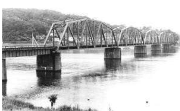
T50041、郷川橋梁、島根県、江津市、江川、山陰本線、1920