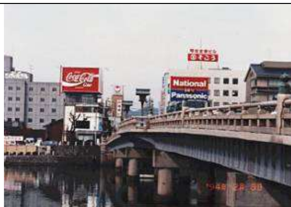
G70331、大橋 通称・松江大橋、島根県、松江市、大橋川(斐伊川)、県道、1937