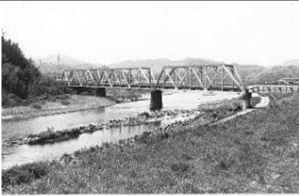
新見川橋梁、森田吉三氏、撮影：1923年、東京海日本