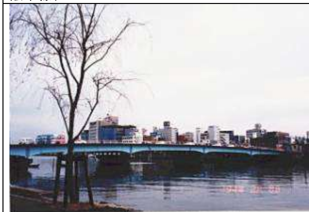
G70251、新大橋、島根県、松江市、大橋川(斐伊川)、県道(架設時国道19号)、1934