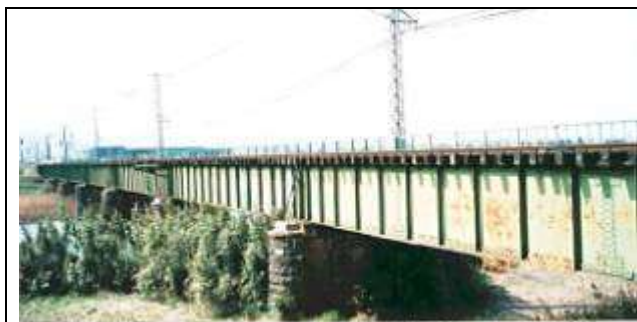
G10121、神戸川橋梁、島根県、出雲市、神戸川、山陰本線、1913