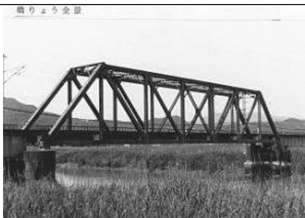
T51141、六角川橋梁、佐賀県、江北町、白石町、六角川、1930