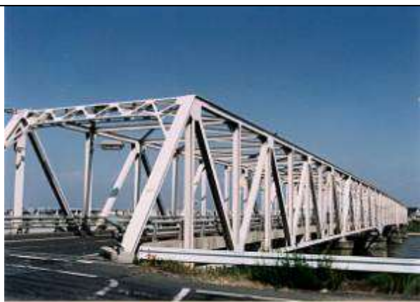
1997年8月23日 改定 2000年8月20日 改定 藤井 郁夫 T110231、諸富橋、佐賀県、諸富町、筑後川、国道、1955