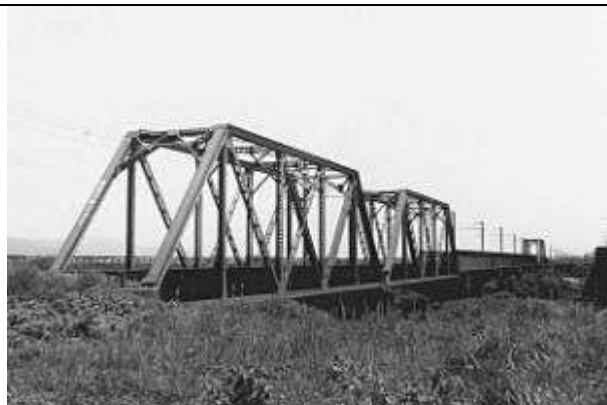
T50382、嘉瀬川橋梁上り線、佐賀県、佐賀市、久保田町、嘉瀬川、1920