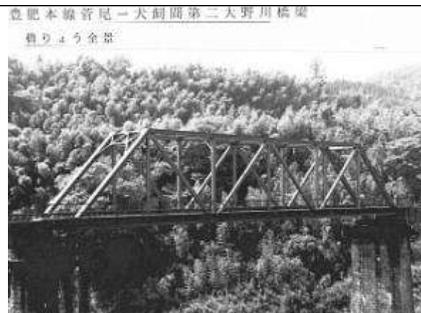
豊肥本線音記一大割間第二大野川橋梁 積りょう全景

G50041、明治橋、大分県、野津(のつ)町、野津(のつ)川、国道 502 号、1902