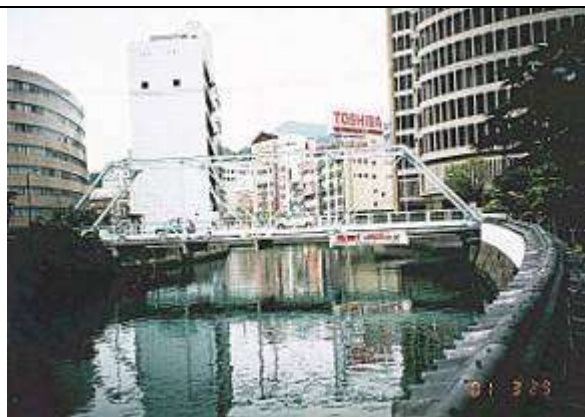
T70031、出島橋、長崎県、長崎市、中島川、プラット トラス(ピン結合)、