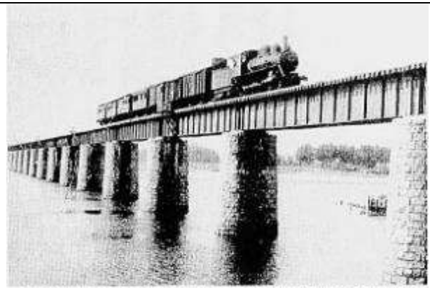
↑大淀川橋梁 完成当初の大正4年3月20日から宮崎県営鉄道に貸与。大正5年10月25日、国有鉄道に経営移管。 G10131.、大淀川橋梁、宮崎県、宮崎市、大淀川、日豊本線、1916