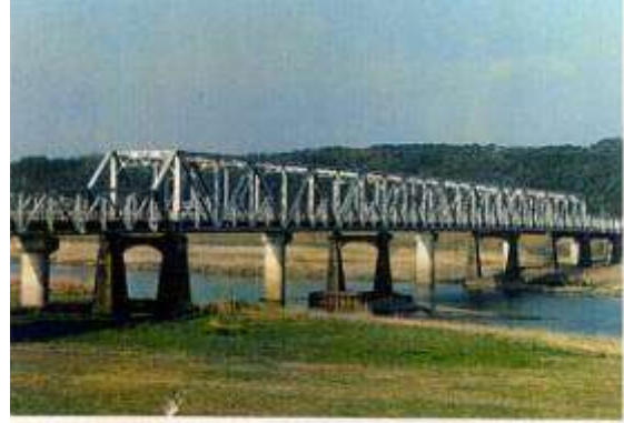
(撮影 松田 浩 1994年) 作成 1994-4-9 作成 藤井 郁夫 T110011、小丸大橋、宮崎県、高鍋(たかなべ)町、小丸(おまる)川、国道 3 号、1948