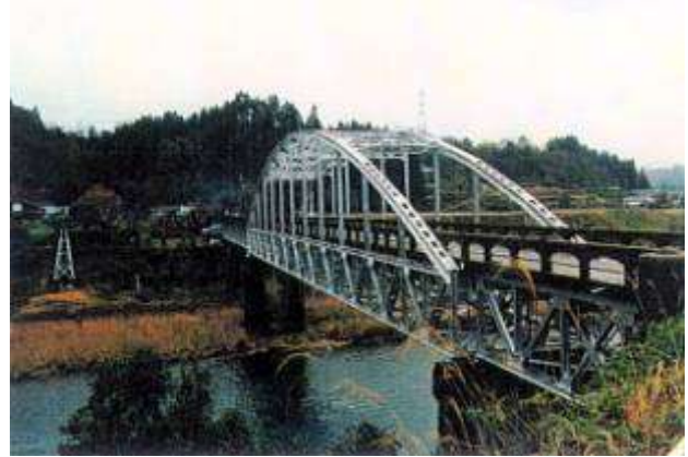
A70021.、八重原橋、宮崎県、東郷町、耳(みみ)川、①中路ランガートラス、1949