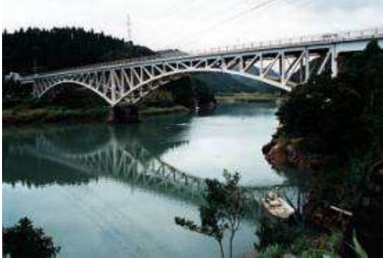
A50461.、美々津橋、宮崎県、日向市美々津町、耳(みみ)川、県道、1934