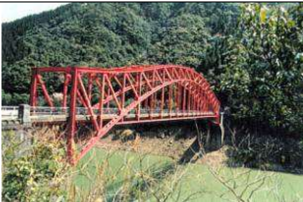
A70051.、尾鈴橋、宮崎県、木城(きじょう)町、小丸(おまる)川、県道延岡西都線、1951