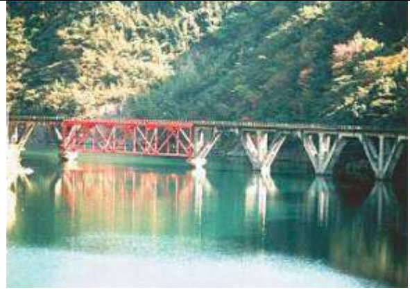
T51562、第三五ヶ瀬川橋梁、宮崎県、日之影町、五ヶ瀬川、高千穂鉄道、1939