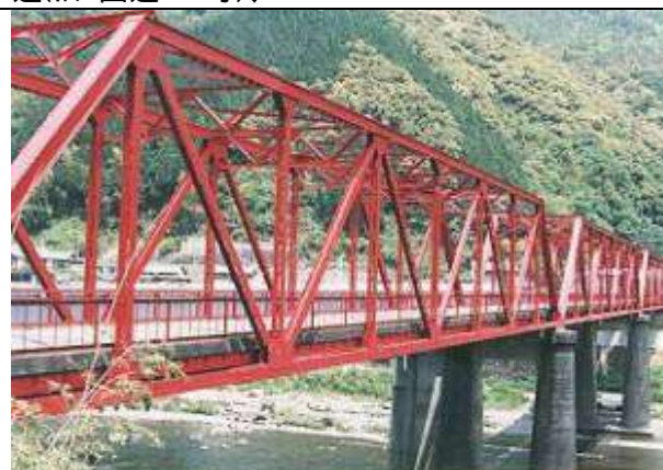
T90511、大正橋、高知県、大正町、檜原川、国道381号、1928 1995年 作成 1995年5月14日 作成 藤井 郁夫