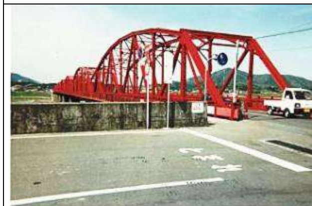
T80101、四万十川橋(渡川橋)、高知県、中村市、四万十川、県道(建設時) 1969年から国道56号 1975年から県道、1926 1994-4-