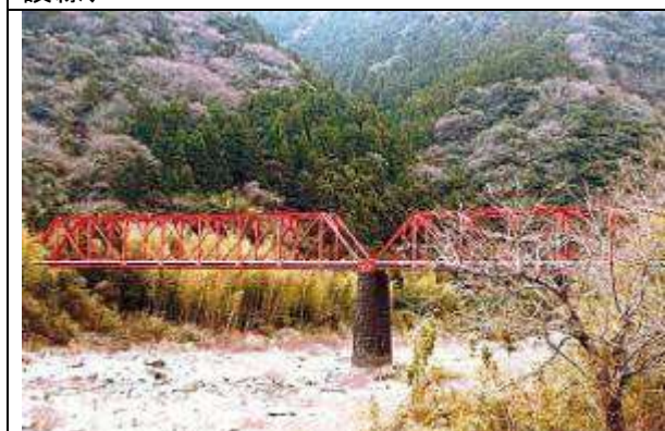
T51831、小島橋、高知県、北川村、奈半利川、(旧)魚梁瀬森林鉄道奈半利川線、1931