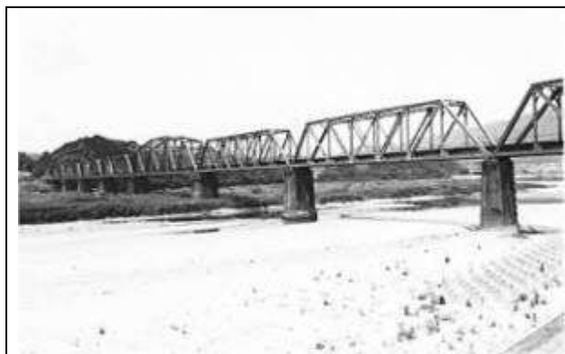
T50101、仁淀川橋梁、高知県、伊野町、仁淀川、土讃線、1924