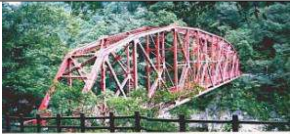
T90581、仁淀川橋、高知県、伊野町、仁淀川、国道33号、1930