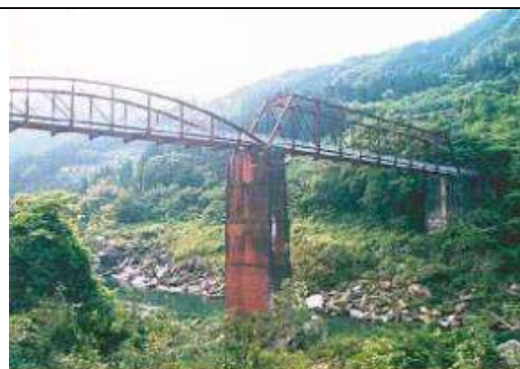
T70091、吉野川橋(旧)、高知県、大豊町、吉野川、町道(旧・国道32号)、1911 撮影 北水 公一 (大豊町) 2000年8月 作成 2000年11月 作成 藤井 郁夫