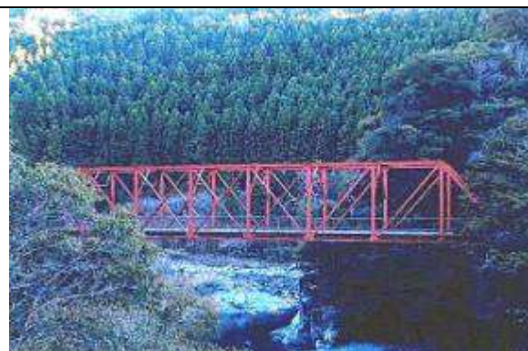
T51782、明神口橋、高知県、安田町、安田川、(旧)魚梁瀬森林鉄道/安田川線、1929