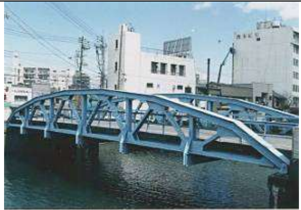
T90651、菜園場橋、高知県、高知市、東西堀割、下路ポニーボーストリングトラス、