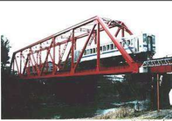
T20301、第二白川橋梁、熊本県、熊本市、白川、豊肥本線、1954