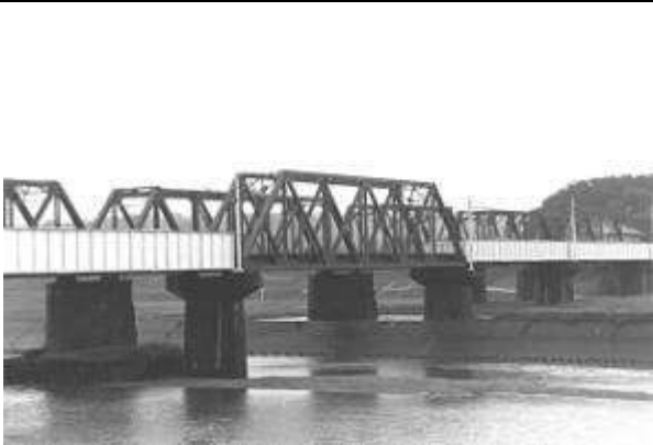
T50411、高瀬川橋梁上り線、熊本県、玉名市、菊池川、鹿児島本線、1968