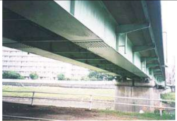
1998年5月11日 作成 2000年11月5日 作成 藤井 郁夫