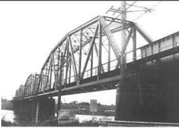
T50501、球磨川橋梁、熊本県、八代市、球磨川、鹿児島本線、1923