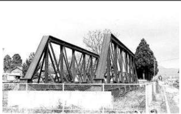
T40061、(旧)菊池川橋梁、熊本県、植木町、(保存展示)、1970