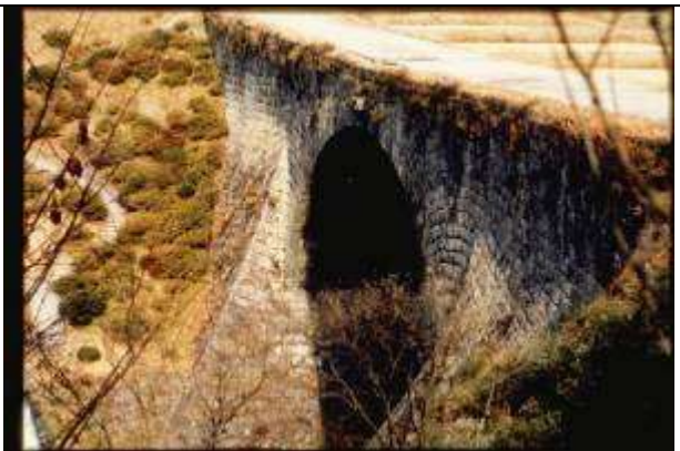
KRS039、通潤橋、JP、熊本、石造アーチ、1854、28.2m、サイホンの原理による通水を行っている