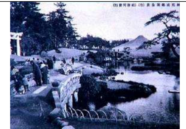
SMDJAPB030 神苑成趣園の橋熊本水前寺出水神社の神苑の景観、絵葉書より 19950130