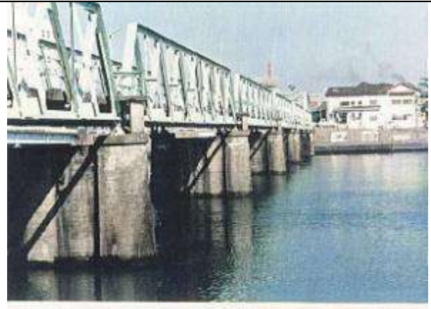
T90601、前川橋、熊本県、八代市、前川、下路ポニ一、1964