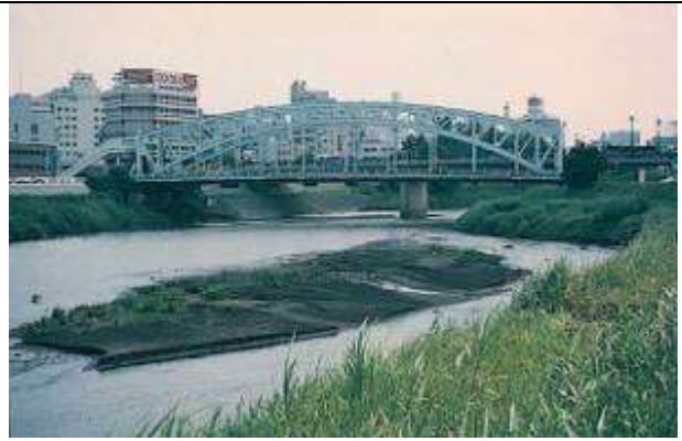
A50011、長六橋、熊本県、熊本(くまもと)市川原町～迎町、白(しら)川、国道2号、1927