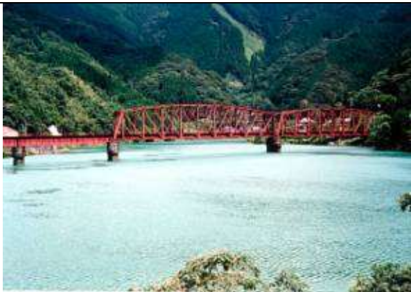
T10081、第一球磨川橋梁、熊本県、坂本村、球磨川、肥薩線、1908