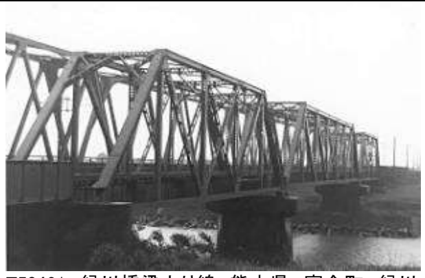
T50421、緑川橋梁上り線、熊本県、富合町、緑川、鹿児島本線、1921