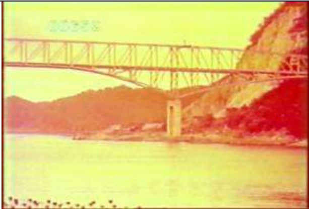
653、KRNT000611、天門橋、JP、橋脚を含む片側半分、トラス橋