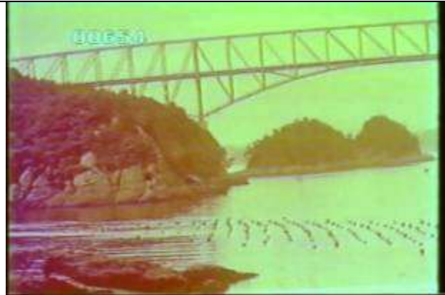
654、KRNT000610、天門橋、JP、片側半分、橋脚が隠れて見えない、トラス橋、