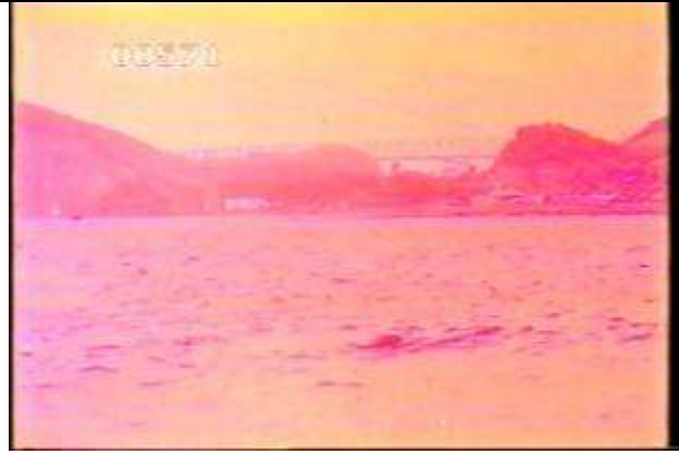
571、KRNT000612、天門橋？、JP、全景、トラス橋、