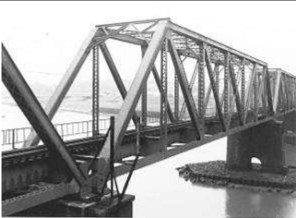
T50292、高瀬川橋梁下り線、熊本県、玉名市、菊池川、鹿児島本線、1916