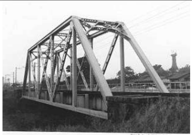
T50301、繁根木川橋梁下り線、熊本県、玉名市、繁根木川、鹿児島本線、1916