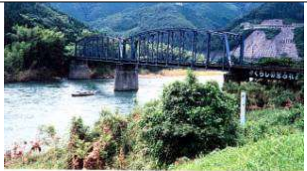
T10091、第二球磨川橋梁、熊本県、球磨村、球磨川、肥薩線、1908