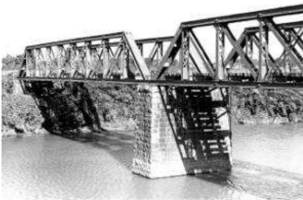
T60031、万之瀬川橋梁、鹿児島県、金峰町、加世田市、万之瀬川、1914