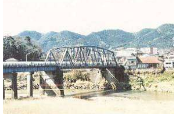
T90681、吉松橋、鹿児島県、吉松町、川内川、1931