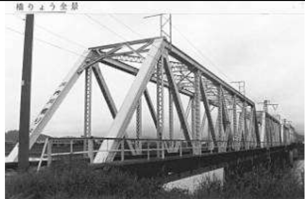
T50443、川内川橋梁、鹿児島県、川内市、川内川、鹿児島本線、1922