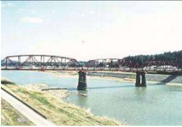
T90901、東郷橋、鹿児島県、東郷町、川内川、県道、1935