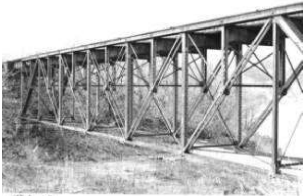
T10201、蟹沢桥梁、福島県、西会津町、蟹沢、磐越西線、1914