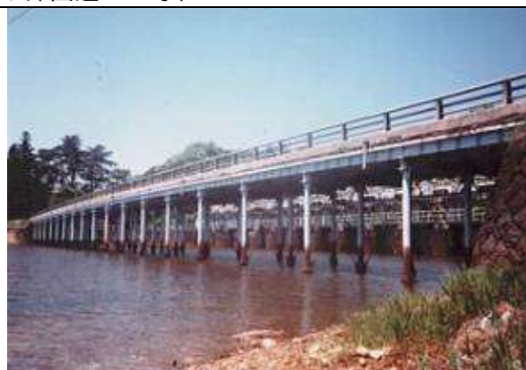
G70043、十六橋、福島県、猪苗代町～会津若松市、日橋川、(旧・若松街道)右岸側 猪苗代町道 左岸側、1928