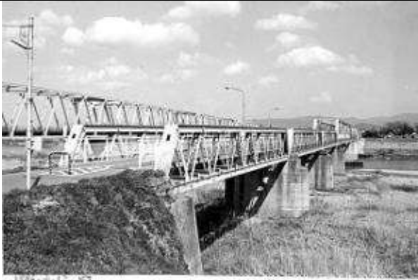
T30041、伊達橋(歩道橋)、福島県、伊達町、阿武隈川、国道、1921