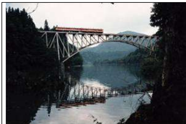
A20071、第一只見川橋梁、福島県、三島町、只見(ただみ)川、只見線、1941