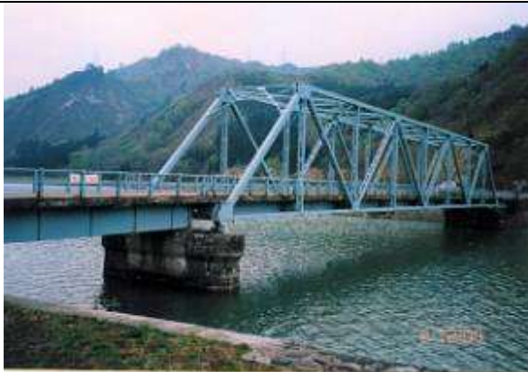
T110181、万代橋、福島県、只見町、只見(ただみ)川、町道、1955 2000-5-12 作成2000年7月1日