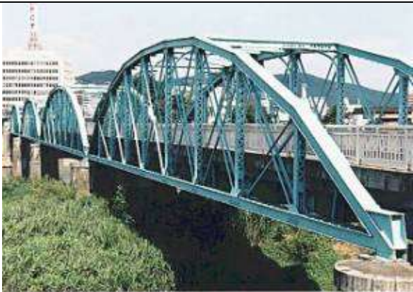
T80071、松齡橋、福島県、福島市、阿武隈川、①下路ボーストリングトラス、1925