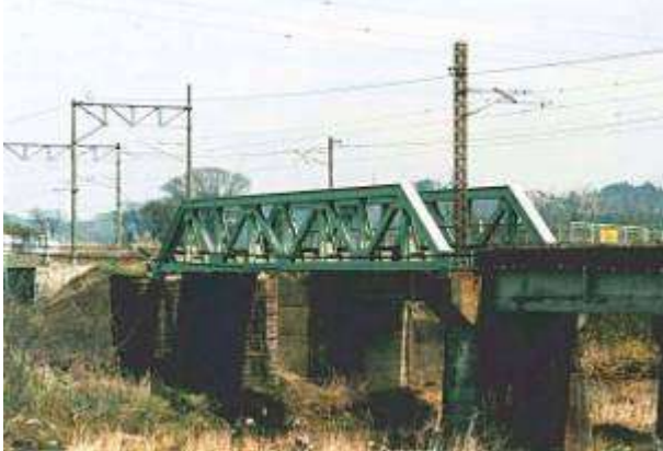
T50321、五百川橋梁下り線、福島県、郡山市、本宮町、五百川、1919