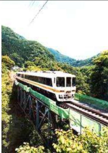
T51361、小野川橋梁、福島県、下郷町、小野川、会津鉄道、1934