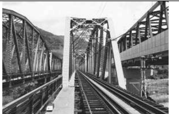
T100212、第七只見川橋梁、福島県、金山町、只見川、只見線、1957