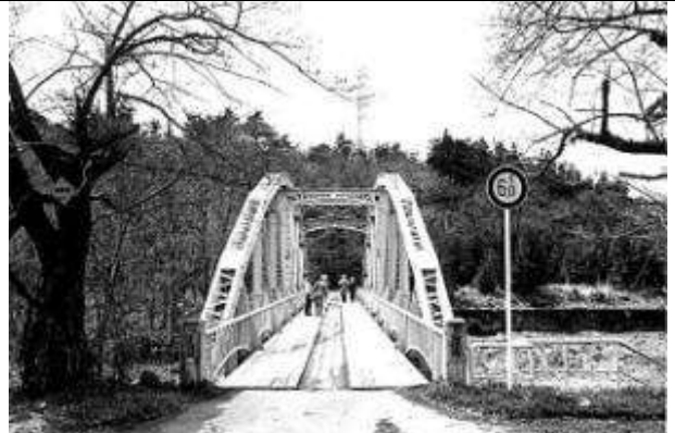
T30091、切立橋、福島県、河東町、塩川町、日橋川、1921