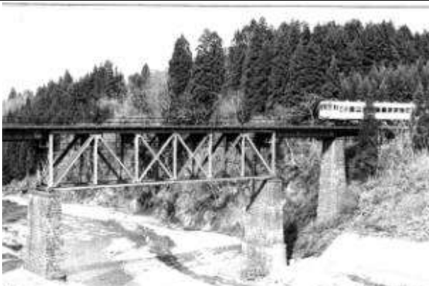
T10191、長谷川桥梁、福島県、西会津町、長谷川、磐越西線、1913