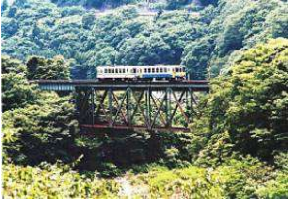
T51373、第四大川橋梁、福島県、下郷町、大川(阿賀川)、会津鉄道、1934