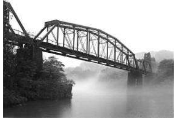
T10211、阿賀野川徳沢桥梁、福島県、西会津町～新潟県鹿瀬町、磐越西線、1914