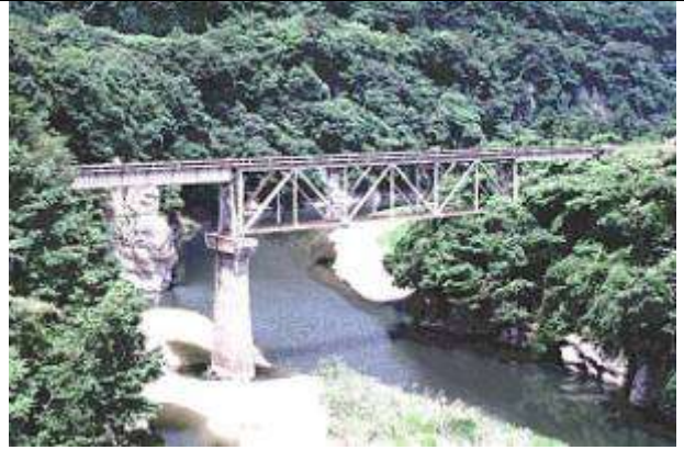
T51381、第五大川橋梁、福島県、下郷町、大川(阿賀川)、会津鉄道、1934