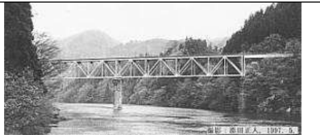
T51621、第二只見川橋梁、福島県、三島町、只見川、只見線、1941