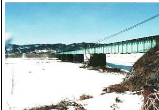
G10101、濁川橋梁、福島県、喜多方市、濁川、磐越西線、1910