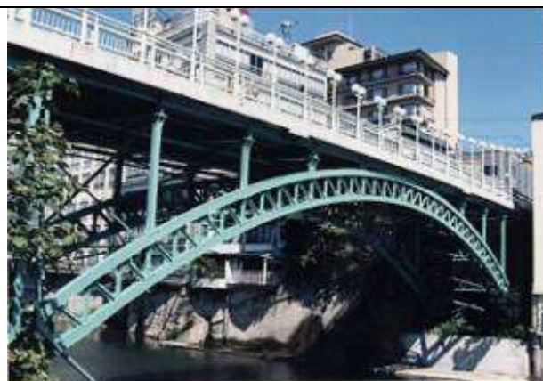
A40031、十綱橋、福島県、福島市飯坂町、摺上川、 県道飯坂～桑折停車場線、1915 1994年9月20日