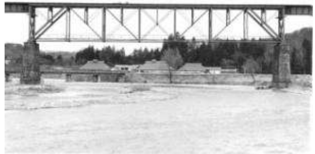
T10111、一ノ戸川桥梁、福島県、山都町、一ノ戸川、磐越西線、,、1910、