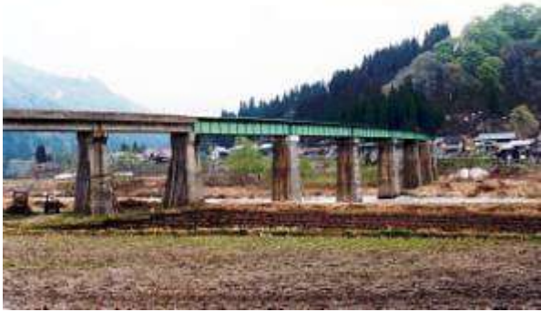
G80032、叶津川桥梁、福島県、只見町、叶津川、只見線、