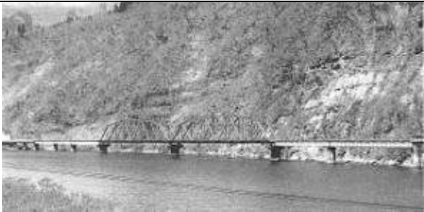
T51491、第八只見川(寄岩)橋梁、福島県、只見町、只見川、只見線、1957