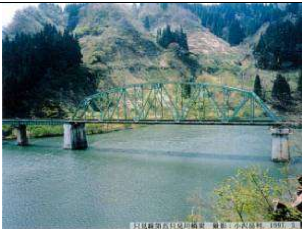
T100182、第五只見川橋梁、福島県、金山町、只見川、只見線、1957