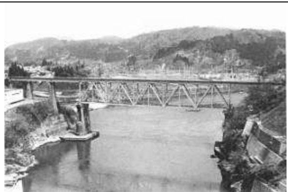
T100192、第六只見川橋梁、福島県、金山町、只見川、只見線、1957