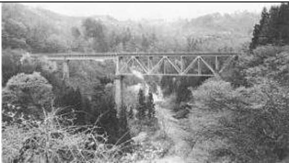
T51611、滝谷川橋梁、福島県、柳津町、三島町、滝谷川、1941