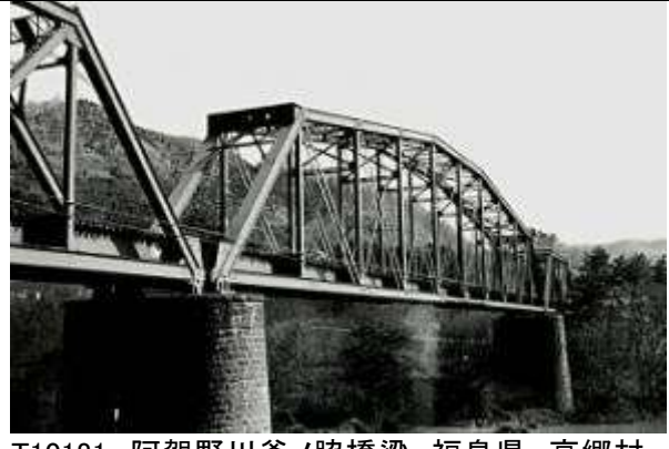
T10181、阿賀野川釜ノ脇桥梁、福島県、高郷村～西会津町、,、磐越西線、1913