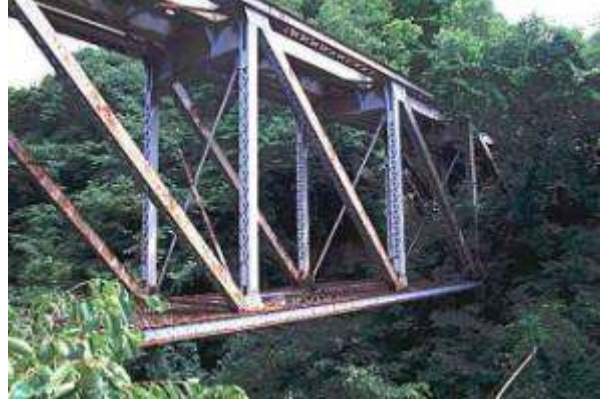
T51291、閻川橋梁、福島県、会津若松市、閻川、会津鉄道、1932