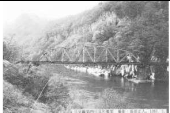
T100162、第四只見川橋梁、福島県、金山町、只見川、只見線、1956