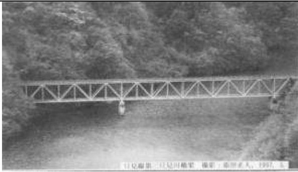
T100152、第三只見川橋梁、福島県、三島町、只見川、只見線、1956