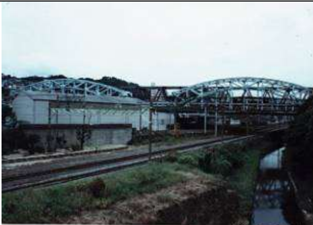
A20031、枝光橋、福岡県、北九州市、枝光(えだみつ)川、JR九州鹿児島本線、1930