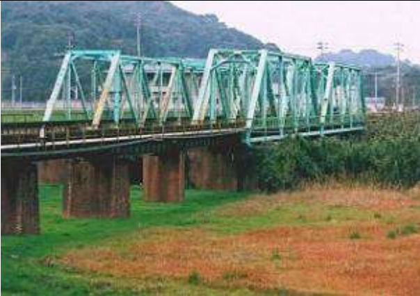
T50271、嘉麻川橋梁下り線、福岡県、直方市、小竹町、嘉麻川(遠賀川)、1915