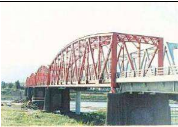
T90661、筑後川橋(片の瀬橋)、福岡県、田主丸町、筑後川、県道、1931