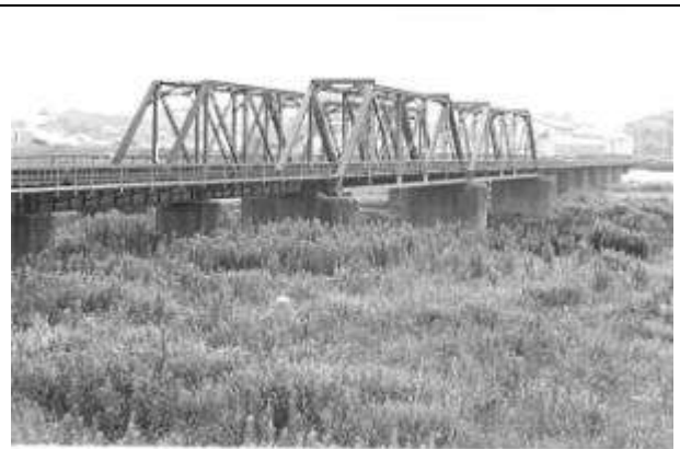
T10131、嘉麻川橋梁(上り線)、福岡県、直方市～小竹町、遠賀川(嘉麻川)、平成筑豊鉄道伊田線、1909