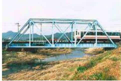
T50611、高屋川橋梁、福岡県、犀川町、高屋川、平成筑豊鉄道田川線、1924