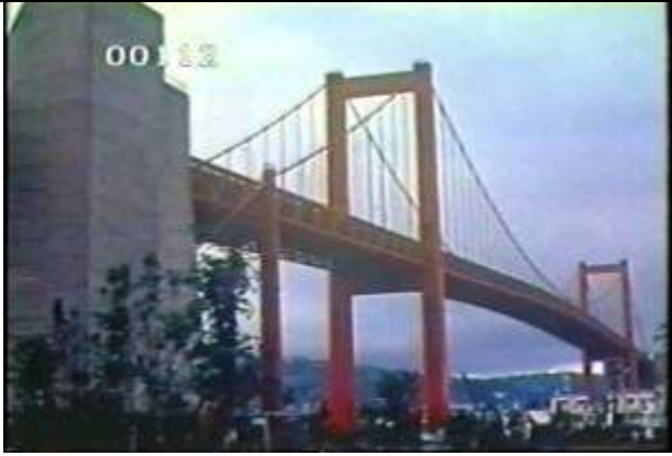
112、KRNSJ00201、若戸大橋、JP、斜めから全景、19650600