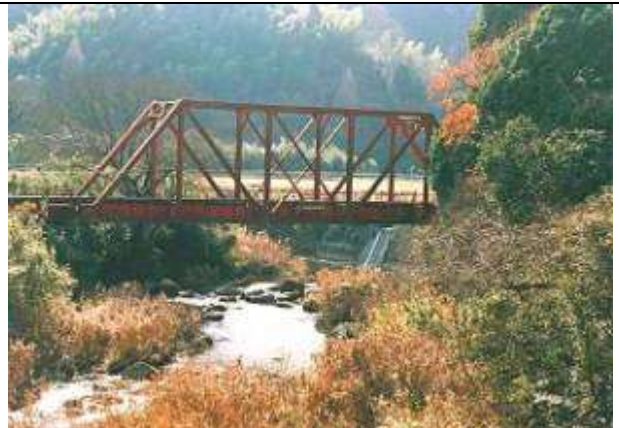
T50593、第四今川橋梁、福岡県、赤村、今川、平成筑豊鉄道田川線、1914