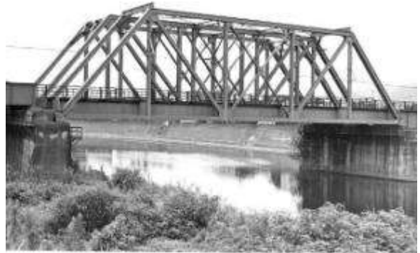
T60061、彦山川橋梁、福岡県、田川市、彦山川、国鉄田川線、1955