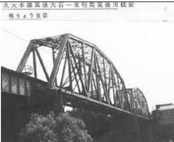
T51303、筑後川橋梁、福岡県、浮羽町、大分県日田市、筑後川、1932