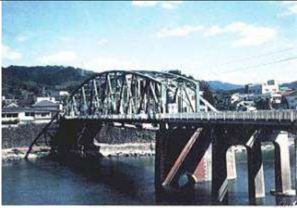
(撮影 岡林 隆雄 1994年) 作成 1994-4-9 作成 藤井 郁夫