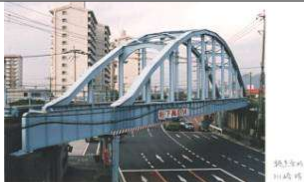
A60031、多々良架道橋、福岡県、福岡市東区、(国道3号)、福岡県博多臨港線、1954