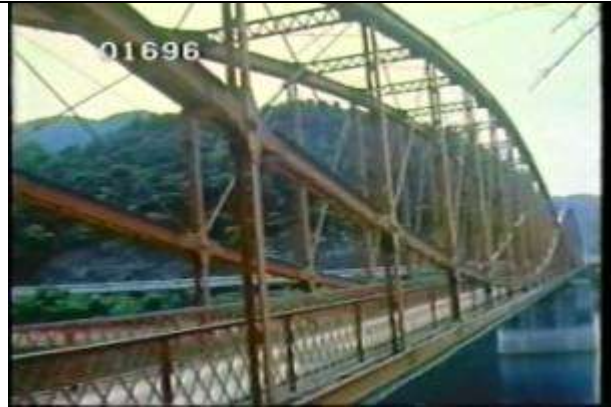
11696、YMD0882813、魚形橋、JP、北九州市、全景、198810??