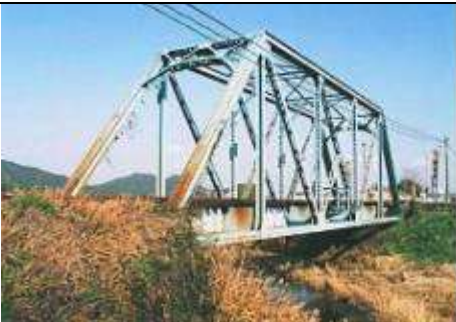
T50561、喜多良川橋梁、福岡県、犀川町、喜多良川、平成筑豊鉄道田川線、1924