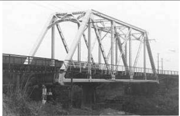
T50312、荒木川橋梁下り線、福岡県、久留米市、広川、鹿児島本線、1917