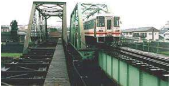
T50602、彦山川橋梁、福岡県、田川市、彦山川、平成筑豊鉄道田川線、1925