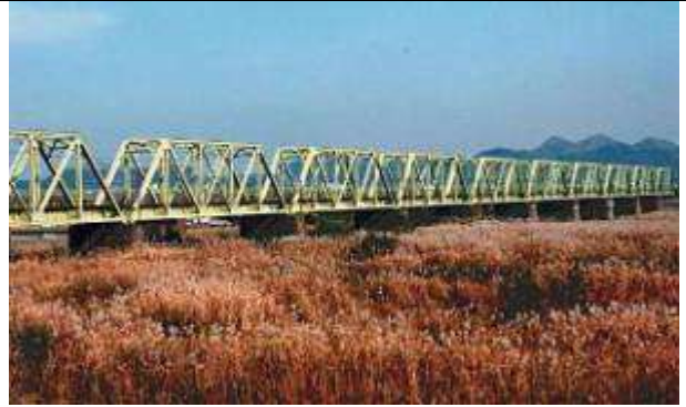
T50081、遠賀川橋梁下り線、福岡県、中間市、遠賀川、筑豊本線、1923