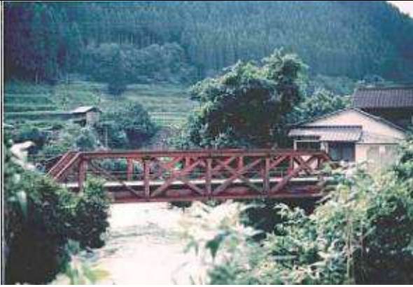
T30221、石岡橋、福岡県、八女郡矢部村、矢部川、村道、1961