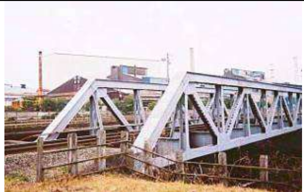
T50342、浜野川橋梁、千葉県、千葉市、浜野川、京葉臨海鉄道、1963