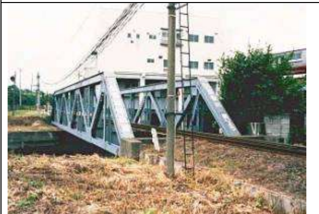
T50351、白旗川橋梁、千葉県、千葉市、浜野川、京葉臨海鉄道、1963