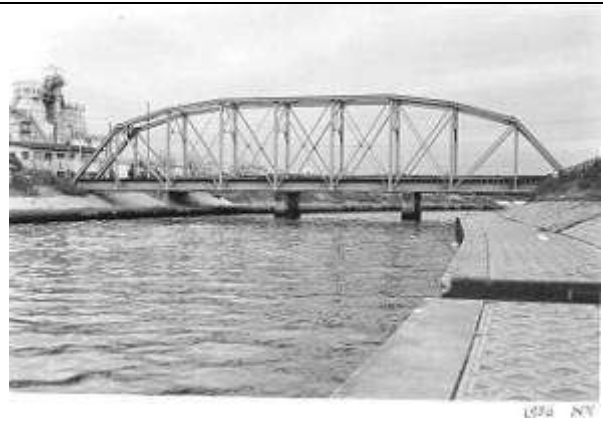
T20201、村田川橋梁、千葉県、千葉市、市原市、村田川、1963