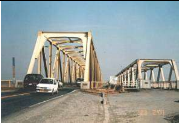
T110332、芽吹大橋(工事名 目吹橋)、千葉県、野田市、利根川、県道、1958