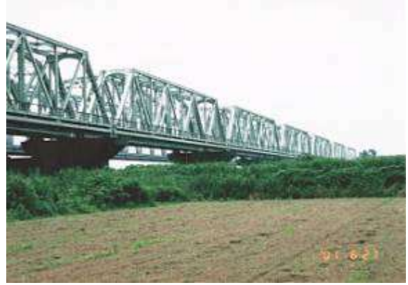
T100251、利根川橋梁快速下り線、千葉県、我孫子市、取手市、利根川、1958