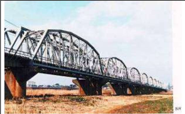
T50061、利根川橋梁(快速上り線)、千葉県、我孫子市、取手市、利根川、1905