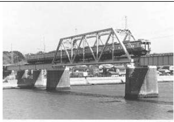
T50621、湊川橋梁、千葉県、富津市、湊川、内房線、1925