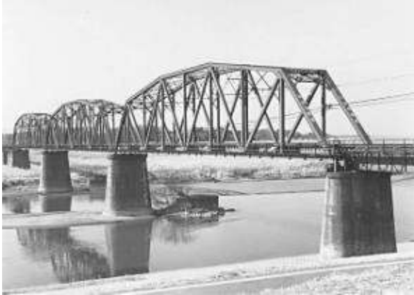
T51161、江戸川橋梁、千葉県、野田市、庄和町、江戸川、1930