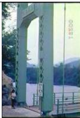
231、KRNSJ00416、市野橋、JP、秋田県、塔の基部と高欄、ピン支承、無補剛吊橋、19630600