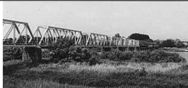
T50651、米代川橋梁、秋田県、能代市、米代川、五能線、1926