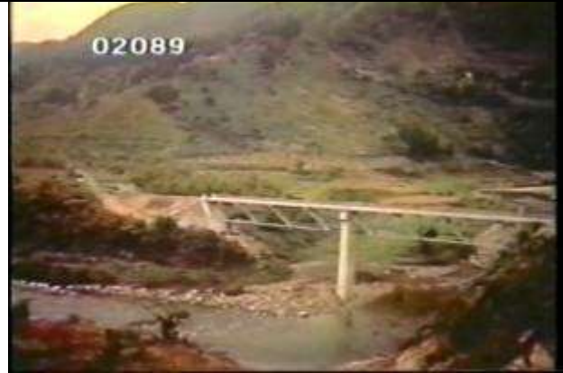
2089、KRNT000214、不明橋、JP、秋田県、遠景、2径間、三角断面、