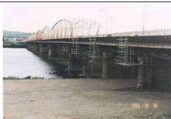
T90821、秋田大橋、秋田県、秋田市、雄物川、国道7号、1934