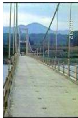
232、KRNSJ00410、市野橋、JP、秋田県、路面上で路面、塔、ケーブル、ハンガーおよび高欄を撮影、無補剛吊橋、19630500