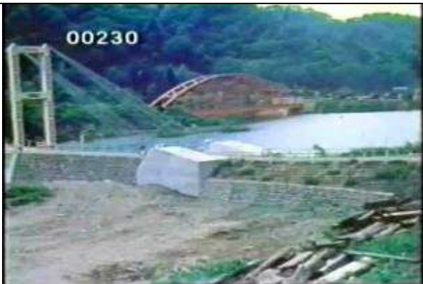
KRNSJ00413、秋田県、赤いアーチ橋を背景に撮影した、市野橋のアンカーブロック、塔とケーブル。無補剛吊橋。19630600