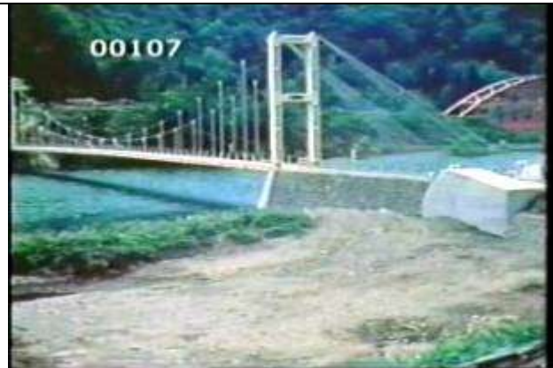
107、KRNSJ00414、市野橋、JP、秋田県、無補剛吊橋、19630600