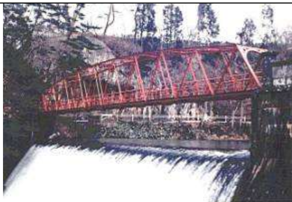
T70071、藤倉水源地堤上架橋、秋田県、秋田市、旭川、下路曲弦ワーレン、