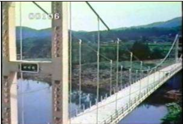
106、KRNSJ00516、市野橋、JP、秋田県、斜めからほぼ全景を撮影、ピン支承、無補剛吊橋、19630600