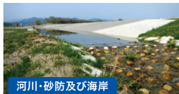
河川・砂防及び海岸

当社では施設の整備手法の検討から事業者選定支援、整備事業のアドバイザー業務を行いました。