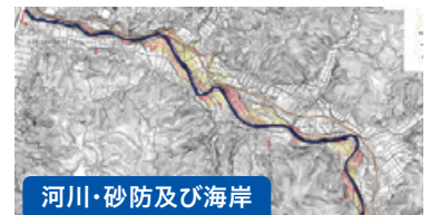
河川・砂防及び海岸

一級河川宮川のせせらぎ水路、親水護岸、高水敷整正の設計及び河床変動解析、平面二次元流解析による効果検証を実施しました。